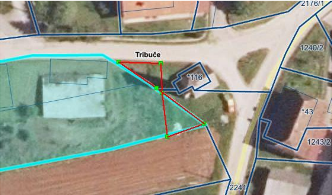
Priloga: Prikaz zemljišča