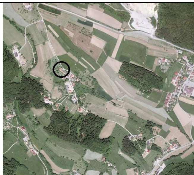
Slika 3: Širši prikaz v prostoru – ortofoto