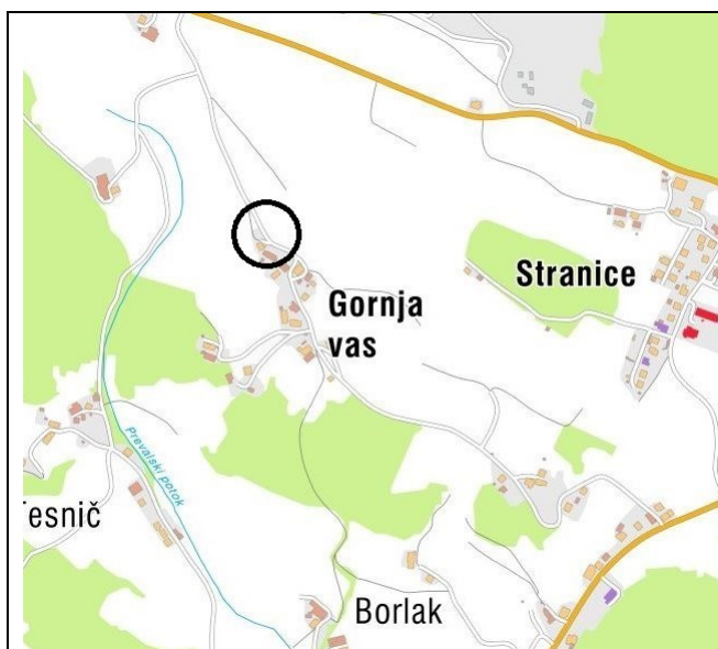
Slika 2: Širši prikaz v prostoru – tipologija