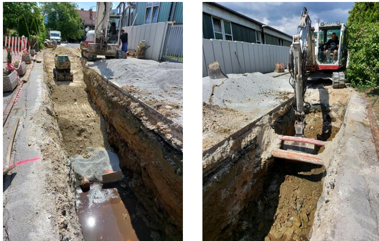
Sliki 12 in 13: Dela na sekundarni fekalni kanalizaciji – sklop 4

Pogodbena vrednost del je 358.614,29 € brez DDV. Izvajalec AGM Nemeč bo zgradil 1,34 km sekundarne kanalizacije na območju dela Strme ceste, Tovarniške ceste in Vinogradne ter del Zlakovške ceste in Ilirske poti. Rok za dokončanje omenjenih del je 150 koledarskih dni od uvedbe v delo. S tem bomo omogočili priključitev na ČN Zreče 114 prebivalcem omenjenega območja. Izvajalec del je z deli z novo ekipo pričel v začetku meseca avgusta 2022 (ob začetku kolektivnega dopusta podjetja Weiler). V prvi fazi se izvaja meteorna in fekalna kanalizacija na odseku od Uniorja do vratarnice Weiler.