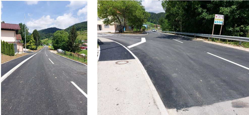
Sliki 16 in 17: Urejena cesta in pločnik Mladinska ulica-krožišče Padežnik

Izvajalec je glavnino del končal v zastavljenem roku, to je do 6. 6. 2022, vendar pa še ni zaključil z vsemi pogodbenimi obveznostmi. Potrebno je popravilo ograje in izvesti zaključek odvodnjavanja ceste, kjer se sedaj voda prosto razliva po površini travnika. Čaka se še na komisijiski pregled objekta s strani DRSI, ter na končni obračun del.