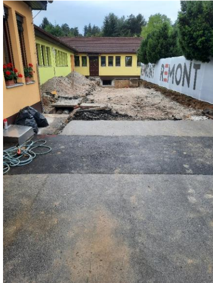
Slika 28: Pričetek gradnje kuhinje Vrtca Zreče

Pripravila: Sandra Vidmar Korošec, višja svetovalka za negospodarske dejavnosti