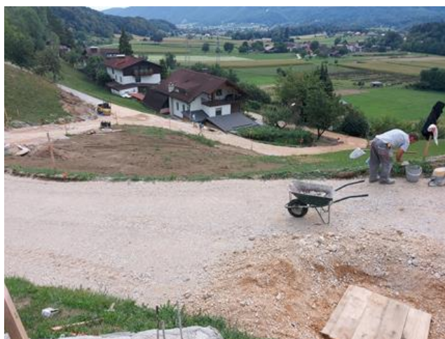
Sliki 14 in 15: Dela na sekundarni fekalni kanalizaciji – sklop 6

Nato so se 15. 9. 2022 dela nadaljevala na kanalu S9 iz najjužnejše točke projekta proti Rudniški cesti. Celoten projekt na tem sklopu 6 pa se predvideva zaključiti do 31. 5. 2023.