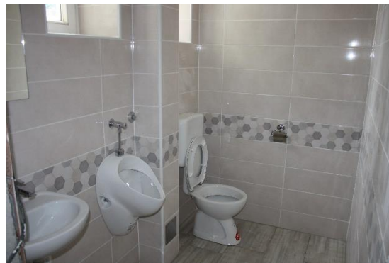
Slike 23, 24, 25 in 26: Obnovljeni prostori stare železniške postaje Zreče

Pripravila: Sandra Vidmar Korošec, višja svetovalka za negospodarske dejavnosti