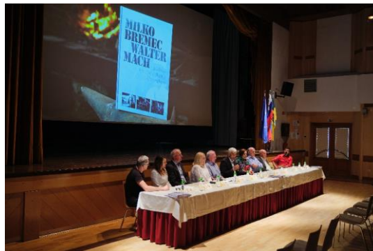
Sliki 19 in 20: Naslovnica monografije in novinarska konferenca ob izidu knjige

Pripravila: Sandra Vidmar Korošec, višja svetovalka za negospodarske dejavnosti