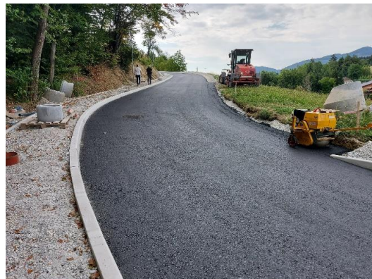
Sliki 10 in 11: Dela na sekundarni fekalni kanalizaciji – sklop 3

Trenutno pa se izvajajo dela na sanaciji ceste v Osredku, kjer se izvede še nov vodovod, optična kanalizacija 2x in javna razsvetljava. Navedena dela bi morala biti zaključena v začetku meseca oktobra 2022. Nakar se ekipa seli na nadaljevanje del na Sklopu 1 (Vodovodna in Obvozna cesta).