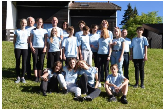
Slika 3: Letošnji udeleženci tabora z mentorji

Tabor je potekal od 3. do 9. julija. Tudi letos je potekal v izvedbi ZOTKS in občin Zreče, Oplotnica in Mislinja, podprli so ga še Društvo ljudske tehnike Zreče, podjetja Unitur, d. o. o., Sklad za naravo Pohorje, Zavoda za varstvo kulturne dediščine Slovenije OE Maribor, Zavod za varstvo narave OE Celje, aktivnosti na taboru pa je podprla tudi Pot med krošnjami Pohorje, d. o. o. Razpisane so bile geološka, botanična, ornitološka in arhitekturna skupina, ki so bile zapolnjene še pred pričetkom tabora. Tabora se je udeležilo 16 mladih raziskovalcev. Več o njihovem raziskovanju si lahko preberete v Poročilu , ki je objavljeno na: https://www.zrece.si/objava/655027 .