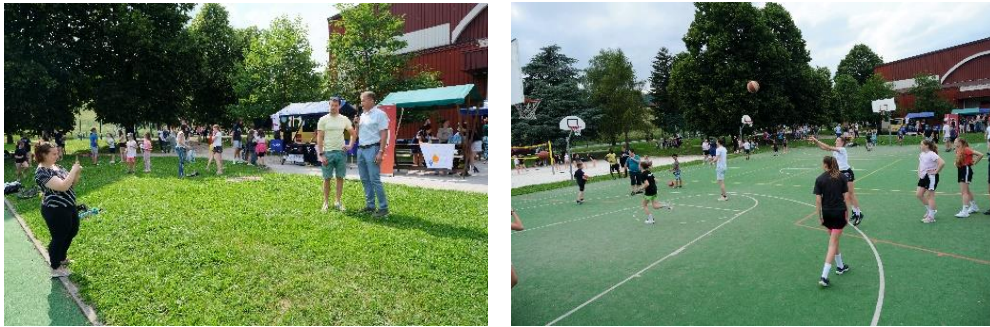
Sliki 21 in 22: Utrinka z dogodka »Aktivno v poletje«

Športno navdušenje je bilo med udeleženci tako veliko, da smo dogodek 22. 9. 2022 ponovili, in sicer AKTIVNO V JESEN .