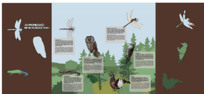
Slika 2: Prikaz nove interpretacijske table na Lovrenških jezerih

Izdelovalec je že izdelal predlog načrta interpretacije. Izvedbena dela zamenjave dotrajanih obstoječih tabel in nadgraditev interpretacije na terenu na območju Lovrenških jezer pa se bodo pričela v mesecu septembru in bodo končana predvidoma v začetku meseca oktobra 2022.