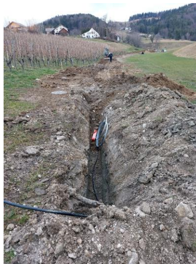
Sliki 8 in 9: Dela na sekundarni fekalni kanalizaciji – sklop 1

Trenutno dela na tem odseku stojijo, ker izvajalec žal nima dodatnih ekip za nadaljevanje del. Nadaljevanje se predvideva v začetku meseca oktobra 2022, ko ekipa AGM NEMEC zaključi dela na Osredku.