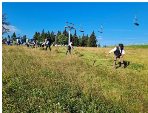
Sliki 4 in 5: Potek košnje pohorskih planj na star način

Pripravila: Katjuša Črešnar, višja svetovalka za okolje in prostor