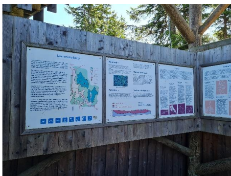
Slika 1: Obstoječe stanje informativnih tabel na Lovrenških jezerih

V sklopu ukrepa bomo nadgradili interpretacijske vsebine na območju Lovrenška barja (novelacija vsebin in zamenjava poškodovanih obstoječih informacijskih tabel).