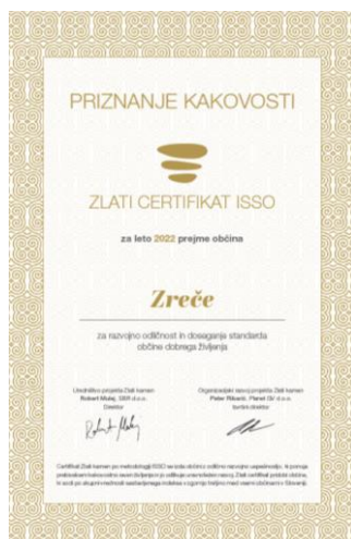
Slika 6: Zlati certifikat ISSO 2022

Pripravila: Milena Slatinek, višja svetovalka za gospodarske dejavnosti