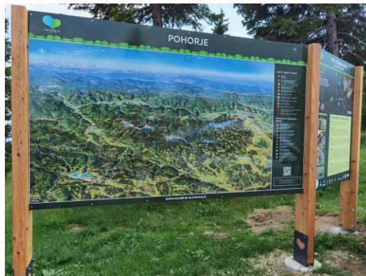
Slika 18: Tabla z zemljevidom Pohorja na Rogli

Med drugim smo skladno z enotno celotno grafično podobo na Rogli postavili novo tablo z zemljevidom Pohorja.