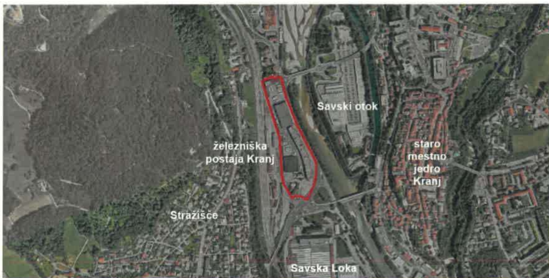
Prikaz območja OPPN na ortofoto posnetku

Območje EUP KR SA 4 se nahaja na zahodnem delu mesta Kranj in obsega površine železniške postaje Kranj s tirnimi napravami in objekti ter območje poslovno logistične cone med železniško infrastrukturo in Ljubljansko cesto. Območje OPPN obsega le vzhodni del območja KR SA 4, ki je v celoti pozidano in v naravi predstavlja preplet različnih dejavnosti in rab. V osrednjem delu se nahaja obstoječi poslovno skladiščni kompleks Kolodvor. Na južnem delu so tri manjše stavbe (stanovanjska stavba, gostinska stavba in poslovna stavba). Območje OPPN na severni strani meji na strnjeno pozidavo pretežno mešane rabe (gostinska, poslovna raba in stanovanjska raba), na vzhodni strani poteka državna cesta Kidričeva – Iskra (R2-412 Kranj), na južni strani križišče K1 'Železniška postaja' in na zahodni strani območje železniške postaje Kranj s pripadajočimi tiri in servisnim območjem v upravljanju Slovenskih železnic.