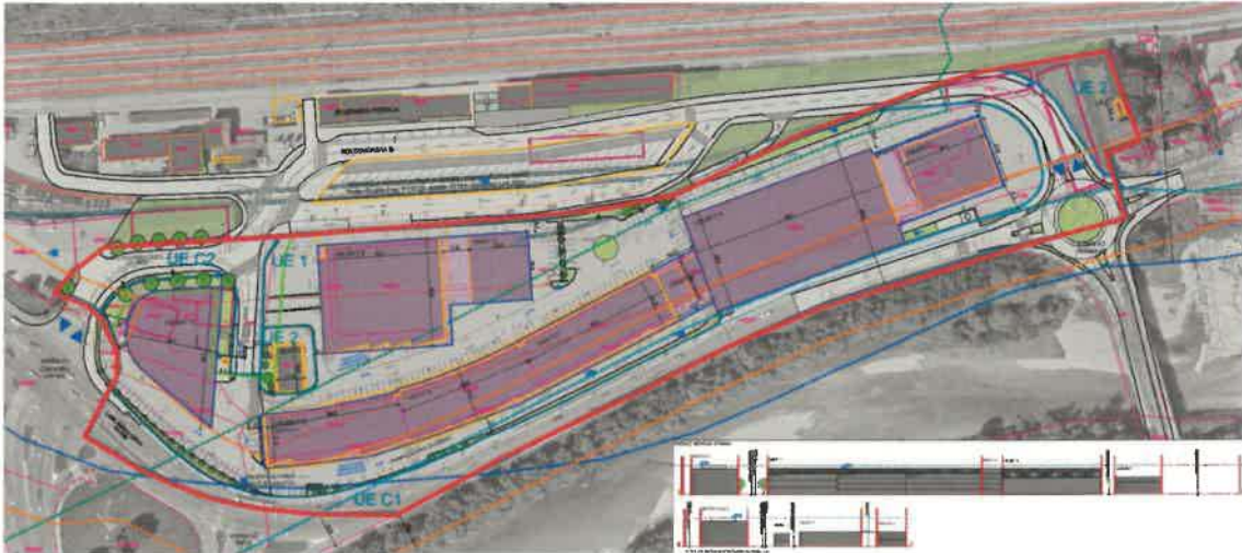
Prikaz pozidave 2. faze urejanja OPPN.

V notranjem območju se v 2. fazi predvidi umestitev nove stavbe G in I ter odstranitev objektov F. Severni del območja UE 1 se preoblikuje skladno s povečanjem UE C1 zaradi rekonstrukcije krožnega križišča K3 'Aguasava'.