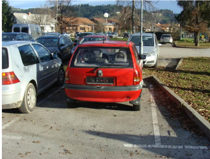
Slika: Zapuščeno vozilo na javnem parkirišču