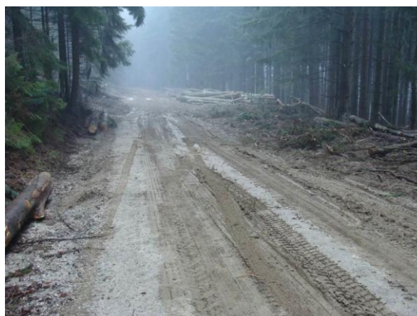
Slika: Onesnaženje/poškodba občinske ceste

Na območju Občine Zreče so občinski redarji in inšpektorica v letu 2014 izvajali naslednje ukrepe, ki so razvidni iz spodnje tabele: