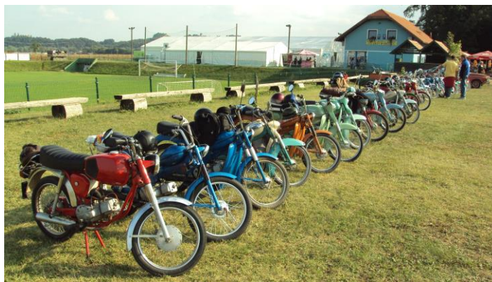
(Prva razstava v Bukovcih, sept. 2011)