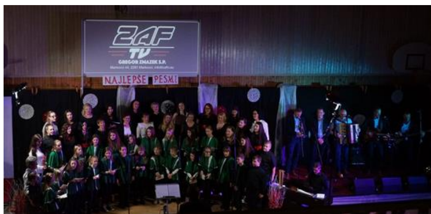
(vir: KD Bukovci, Utrinek s 3. koncerta ženske vokalne skupina Florina, 2019)

Društvo organizira Fašenk v Bukovcih, proslavo ob materinskem dnevu, pomaga mladim pri izdelavi presmeca in postavitvi klopotca, pripravlja srečanje kletarjev, pohode po Haloških poteh, vaške igre in Martinovanje. Društvo sodeluje na občinskih praznikih in prireditvah, ki jih pripravljajo društva Občine Markovci ter pobrateno društvo iz Hrovače. S sekcijo gospodinj pa se društvo večkrat letno udeleži različnih priprav in tekmovanj v kuhanju (langašijada, obarijada, bučijada, ipd), kjer se ponaša tudi z visoko uvrstitvijo.