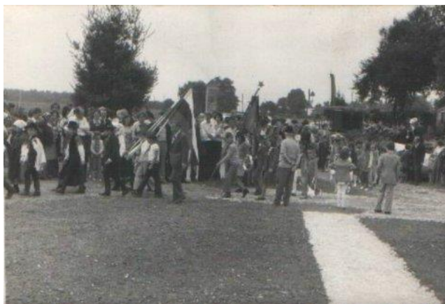
(vir: Prosvetno društvo Prvenci – Strelci; odkritje spomenika 1975)

Najpomembnejša prireditev društva je danes prireditev »Od setve do peke«, ki poteka v začetku julija. Z njo poskušajo prikazati, kako sta žetev in mlatev potekala nekoč.