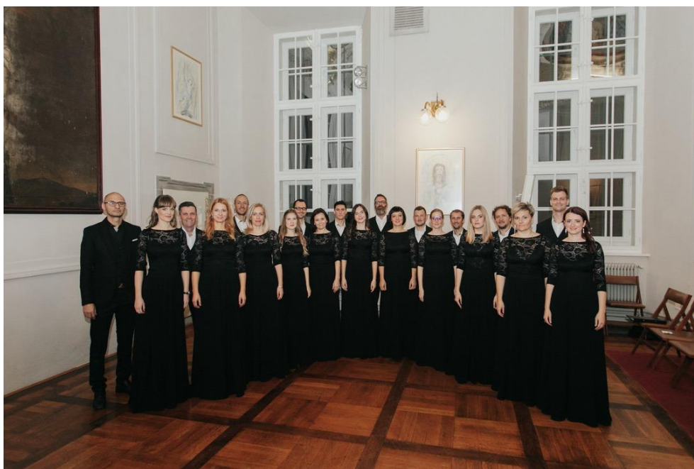
(vir: KUD Kultura; Komorni zbor Kor, koncert Naše pesmi, november 2019)

Društvo si prizadeva k nenehni kulturni rasti, to rast pa želi deliti med ljudi in tako kulturno bogatiti našo občino. Z udeleževanjem na tekmovanjih pa zbor poskrbi tudi za promocijo Občine Markovci.