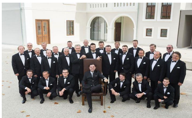
(vir: KD Alojz Štrafela Markovci; moški pevski zbor)

Društvo organizira prireditve s kulturno in etnografsko vsebino, izvaja nastope in kulturne programe ter izdaja publikacije, biltene, gledališke liste, avdio in video material ipd. o delovanju društva oz. posameznih sekcij.