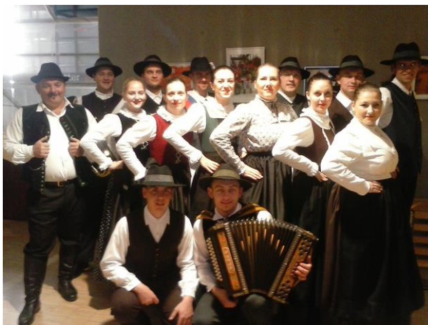
(vir: Folklorno društvo Anton – Jože Štrafela Markovci)

35-letnice. Pevke so prejemnice večih priznanj. Leta 1999 so prejele posebno priznanje Zveze kulturnih društev Ptuj, leta 2000 priznanje Andragoškega centra Slovenije za izjemne učne uspehe in bogatitev lastnega znanja in leta 2008 priznanje zlate Gallusove jubilejne značke Javnega sklada kulturnih dejavnosti RS.