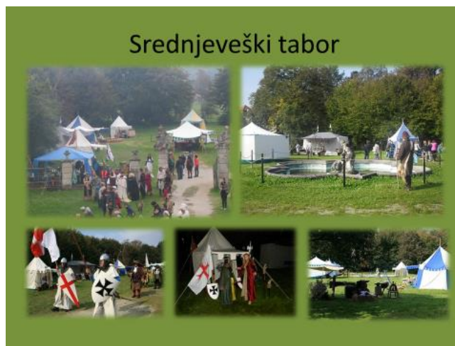
(vir: KUD Baron; Srednjeveški tabor, 2015)