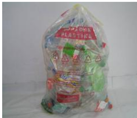
Fotografija 7: Vrečka za mešano embalažo

Za zbiranje steklene embalaže, ki poteka preko zbiralnic ločenih frakcij uporabljamo plastične zabojnike, volumnov 240 l in 1100 l in sicer: