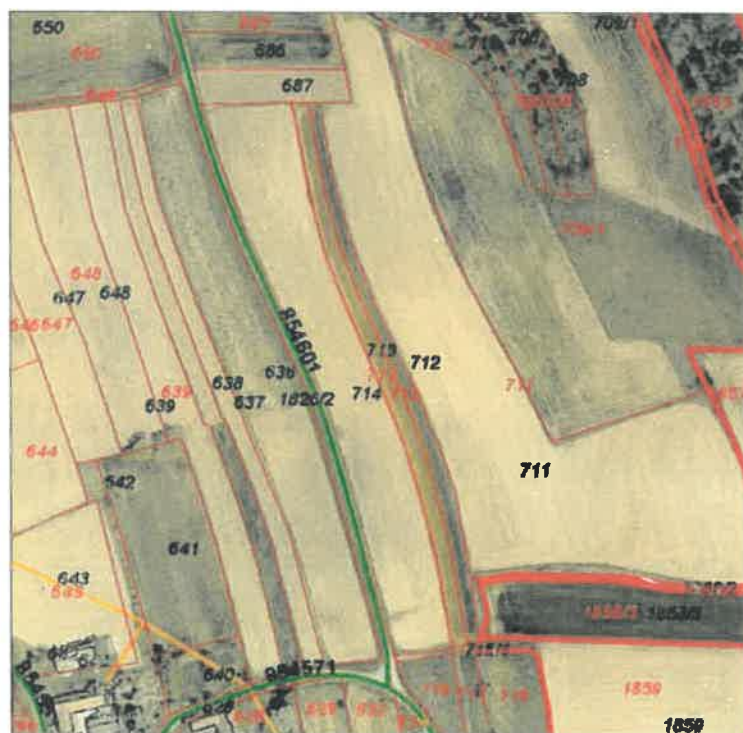
PARCELA 36 713