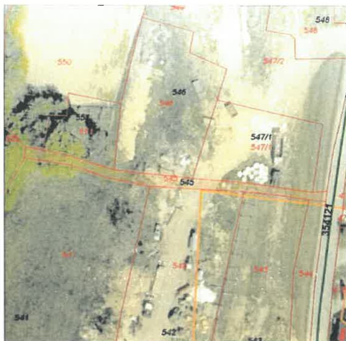
PARCELA 35 545