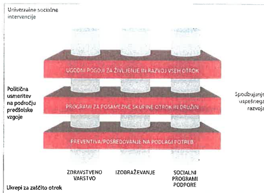
Slika 1: Integrirani model podpornih sistemov na področju dela z otroki do 7. leta starosti in njihovimi družinami (Jacobs Foundation 2012) 2

Uravnoteženost področja zdravstvenega, socialnega in vzgojno-izobraževalnega sektorja ima velik vpliv na dobrobit otrok (Jager in Režek 2020), zato mora celostna skrb za družine in otroke do 7. leta starosti vključevati vse omenjene dimenzije. Še posebej je kakovosten sistem potreben otrokom, ki jim neposredno in družinsko okolje, v katerem živijo, ne more zagotavljati ustreznih spodbud za razvoj in učenje (Iruka idr. 2020), saj imata kulturni in socialni kapital dolgoročen vpliv na razvoj, samouresničitev in uspeh posameznika 3 .