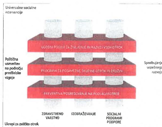
Slika 1: Integrirani model podpornih sistemov na področju dela z otroki do 7. leta starosti in njihovimi družinami (Jacobs Foundation 2012)

Vzpostavljanje povezanih tj. integriranih sistemov za otroke in njihove družine se je naslavljal preko pristopa PRIMOKIZ (shema spodaj), ki so ga razvili v švicarski fundaciji Jacobs Foundation in ki je že bil implementiran v Švici, Romuniji in Nemčiji. Pristop si prizadeva povezovati posamezne vertikalne stebre (tj. izobraževanje, socialno varstvo, zdravstvo) in horizontalne ravni omenjenih stebrov (univerzalna, posamezne skupine, specializirane storitve) oz. oblikovati integrirano okolje v katerem so družine ustrezno podprte in so lahko vsi otroci optimalno uspešni. V iniciativi je osrednji poudarek tudi participacija – tako otrok kot staršev in drugih pomembnih deležnikov omenjenih področij. Vodilo je dejstvo, da vlaganje v intervencije usmerjene v naslavljanje potreb otrok in njihovih družin prinaša družbi dolgoročne prednosti. Prav tako je vlaganje v intervencije v obdobju do 7. leta starosti učinkovitejše in cenejše kot vlaganje v poznejše korektivne posege 1 .