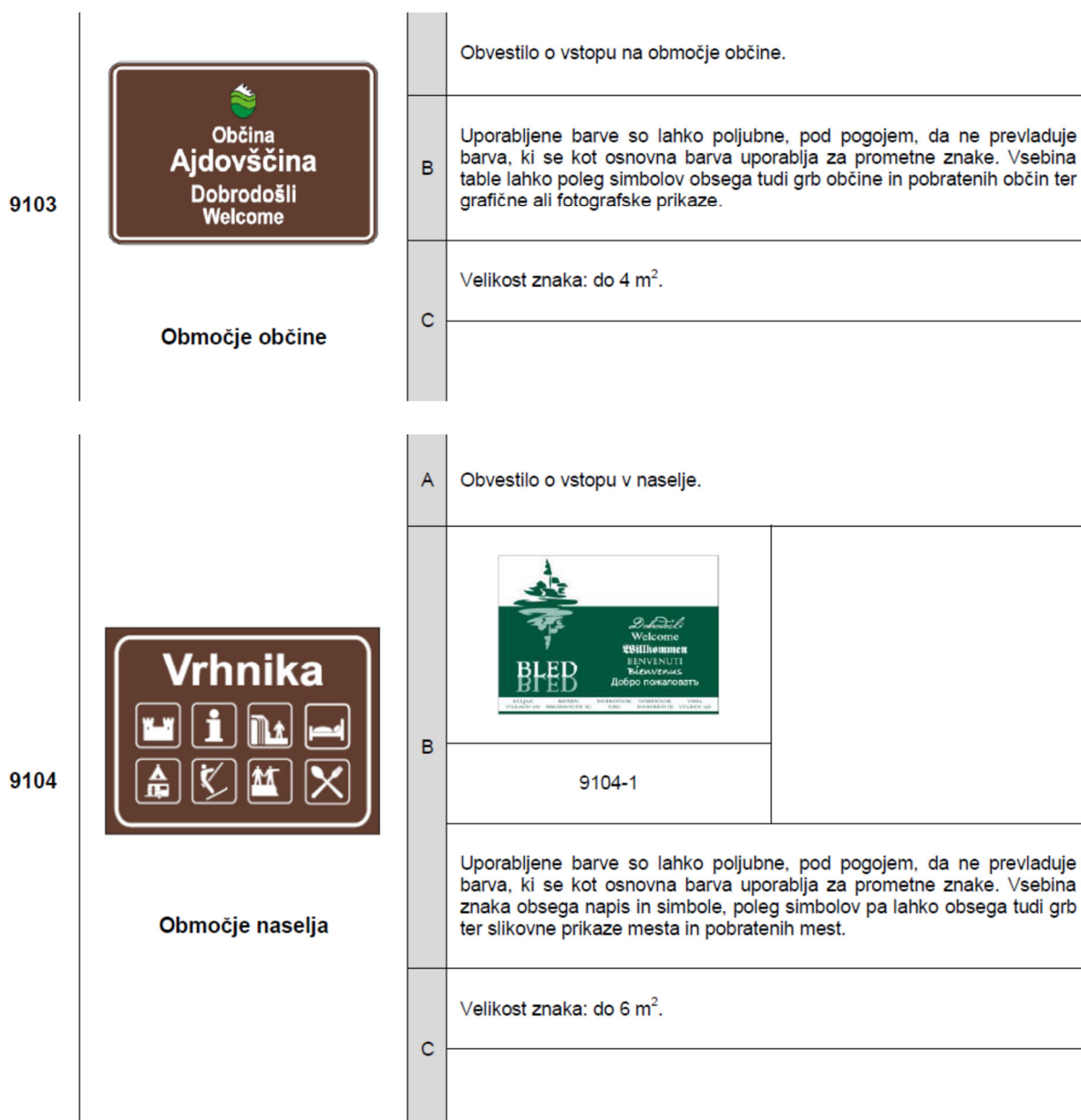
Slika 1 in 2: Izsek prikazov iz Pravilnika o prometni signalizaciji in prometni opremi na cestah (Uradni list RS, št. 99/15, 46/17 in 59/18).

Postavitve turistične in druge obvestilne signalizacije ob cestah so predpisane s Pravilnikom o prometni signalizaciji in prometni opremi na cestah (Ur. list RS, št. 99/15, 46/17 in 59/18). Turistični znaki za izraz dobrodošlice v občino, ki so trenutno postavljeni ob večjih vpadnicah v občino Krško vsebujejo turistični znak občine Krško (metulj z gričevjem). V občinski upravi smo na terenu že zaznali precej pobud za dodatne postavitve navedenih turističnih znakov, pa tudi nekaj teh, ki se nanašajo na njihovo zamenjavo, ker so le-te poškodovane ali oskrunjene. Pravila za postavljanje navedene signalizacije so predpisana z zgoraj navedenim pravilnikom, ki za znake z izrazi dobrodošlice na vstopu na območje občine predpisuje naslednji izgled: