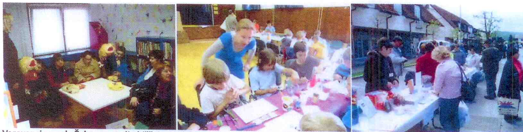
Varovanci zavoda Želva nas radi obišejo. Sodelovali smo pri organizaciji festivala Kultura prostora in na Ivankinem sejmu.

Vključeni smo bili v slovenskih projektih in praznovanjih: Naj knjiga, Mega kviz, Knjige za vsakogar, Dan splošnih knjižnic, Palček Bralček, S knjigo na potep, Knjižni nahrbtnik. Med počitnicami v akciji Knjižničar pri vas gostujemo v krajevnih knjižnicah s knjižnimi kvizi in širšim izborom knjig. Sodelovali smo tudi na Ivankinem sejmu s predstavitvijo knjižnice in uspelo nam je vpisati deset novih bralcev.