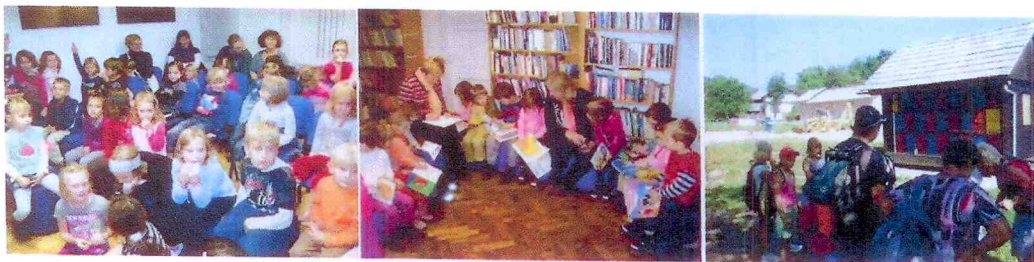
Knjižna in knjižnična vzgoja, ure pravljic, igralne urice s knjigo za najmlajše, Z igro do branja, S knjižnim nahrbtnikom po gozdu in ostale dejavnosti - vse to poteka tako v Ivančni Gorici kot tudi v krajevnih knjižnicah.