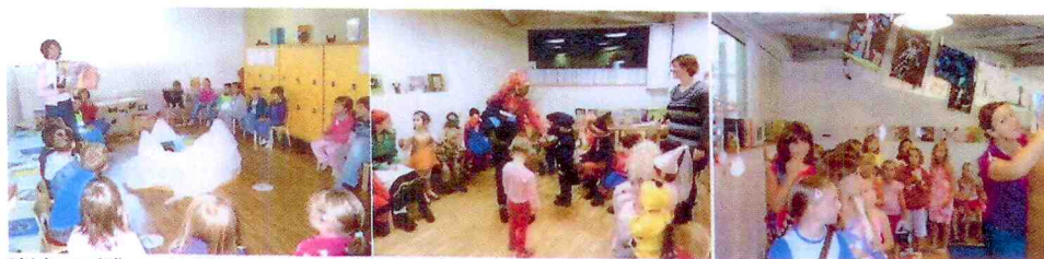
Obisk pravljичnega koticčka, ure pravljic ali počitniške delavnice je vedno prijetno doživetje

Vse oblike dela izvajajo knjižničarke, ki so zadolžene za delo z mladimi.