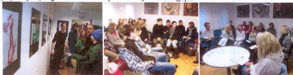
Med mladimi je še posebej zaživel projekt Zgodba v sliki. S srednješolci sodelujemo v projektu Rastem s knjigo, na literarnih srečanjih in delavnicah.

Mlade smo v knjižnico povabili tudi z literarnimi razpisi, srečanjem mladih literatov Bližina misli in delavnico za boljše razumevanje angleščine. Učitelji nas obiskujejo s srednješolci, sodelovali smo v vseslovenskem projektu Rastem s knjigo za srednjo šolo. Učiteljica umetnostne vzgoje je organizirala ogled razstav v knjižnici in pogovore o umetnosti z vsemi razredi SŠJ. Knjižnico so obiskali tudi učenci v okviru učnega načrta in ob praznikih, povezanih s kulturo. Za vse skupine imamo pripravljen program z modeli knjižne in knjižnične vzgoje.