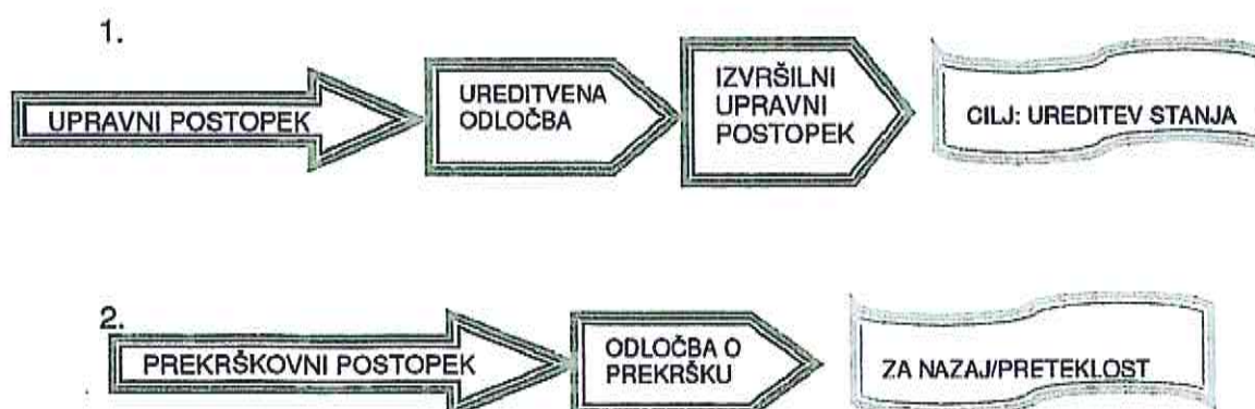
Slika 1: Učinkovanje in namen prekrškovnega in upravnega/inšpekcijskega postopka

Občinski redarji pa opravljajo nadzor tudi nad vsemi določbami občinskih odlokov, za katere jim posamezen odlok daje pooblastilo, je pa občinski redar pristojen za odločanje in vodenje postopkov o prekrških za V. stopnjo izobrazbe, občinski inšpektor pa za odločanje in vodenje postopkov o prekrških za VI. stopnjo izobrazbe ter tako obravnava vse ugovore zoper plačilne naloge občinskega redarja in po preverjanju upravičenosti pošilja zahteve za sodno varstvo na pristojno sodišče.