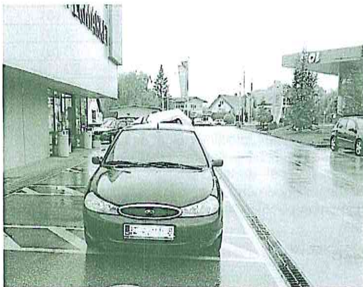
Slika 2 in 3: Primer nedovoljenega parkiranja

Na tem področju opazamo, da smo iz leta v leto uspeli zmanjšati delež prekrškov nepravilnega oz. nedovoljenega parkiranja na pločniku, parkirnih mestih za invalide ali delu ceste, kjer je prost prehod med parkiranim vozilom in neprekinjeno črto ali robom vozišča manj kot 3 metre, kar dejansko pomeni oviranje ali ogrožanje prometa oziroma onemogočanje parkiranja osebam s posebnimi potrebami. Prav tako se je občutno zmanjšalo število kršitev na delih oz. območjih, kjer je bila večkrat postavljena samodejna merilna naprava za merjenje hitrosti.