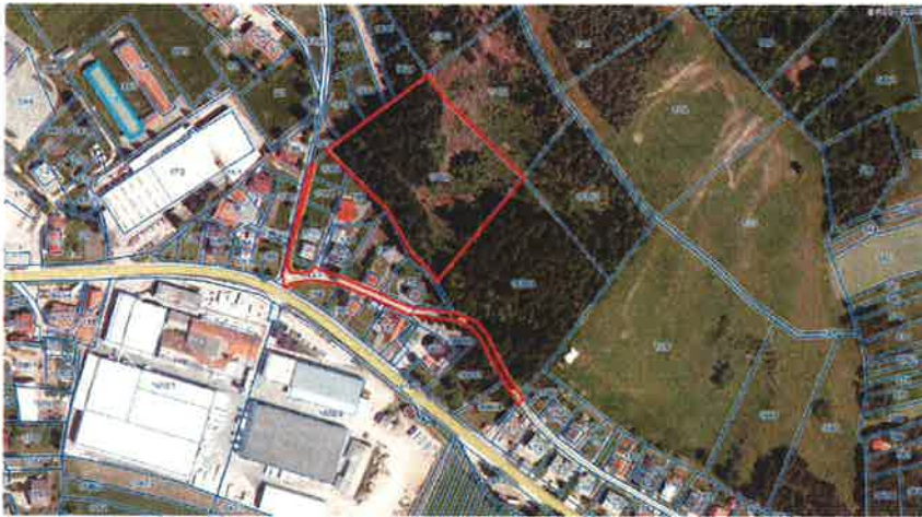
Parcele št. 737/3 k. o. 1683 Nova vas