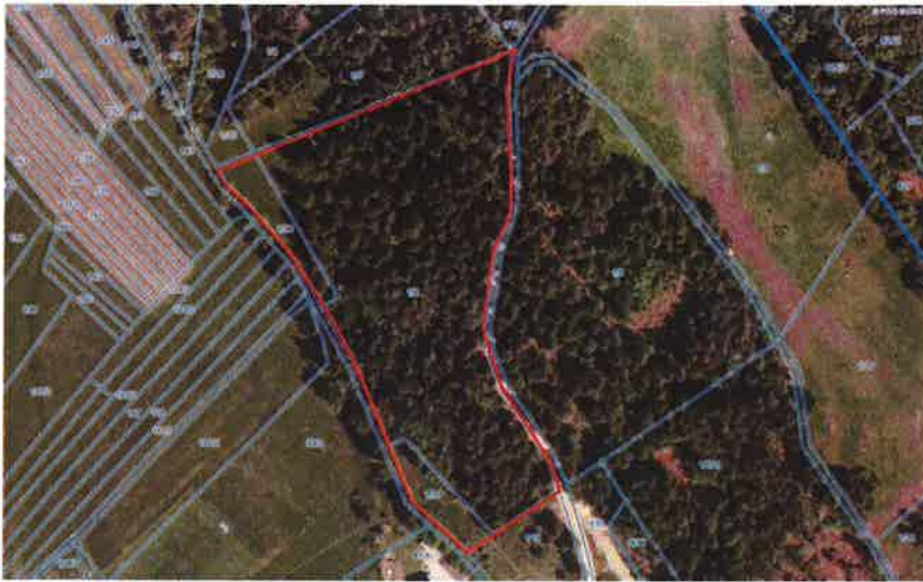
PARCELE ŠT. 1/112, 1/111, 1/110, 1643/1, 1639 in 1/103 k.o. 1683 Nova vas