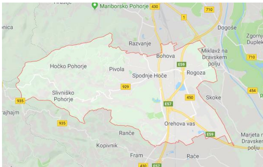
Slika 2: Območje občine Hoče-Slivnica

V obravnavanem letu je bilo v občini zbranih 317 kg komunalnih odpadkov na prebivalca, to je 38 kg manj kot v celotni Sloveniji.