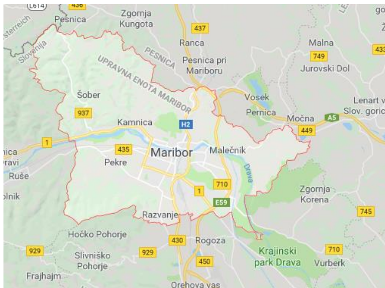
Slika 3: Območje mestna občine Maribor