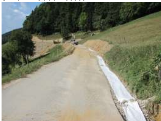
Slika 2: Odsek ceste