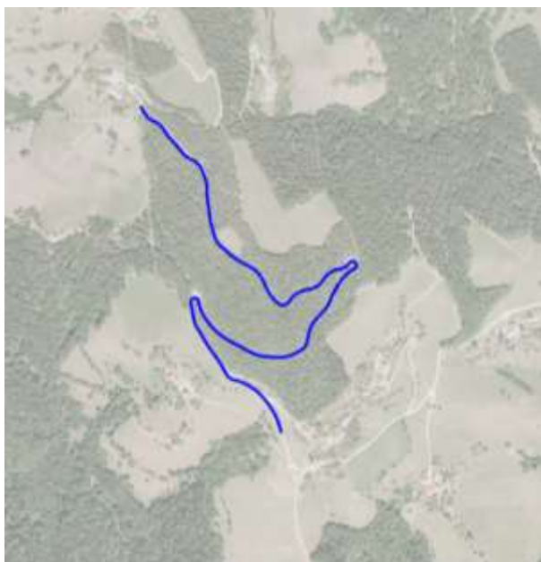
Slika 8: odsek ceste na Strojno