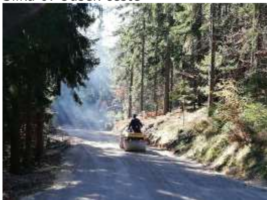
Slika 6: Odsek ceste