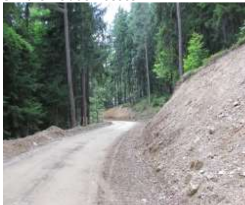
Slika 5: Odsek ceste