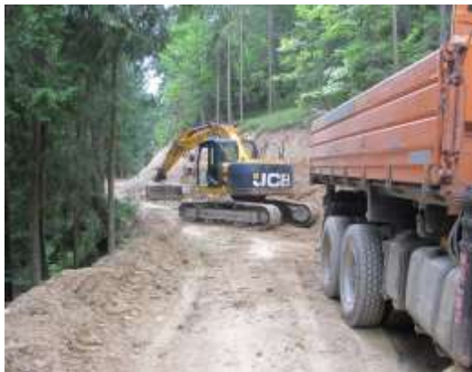
Slika 4: Odsek ceste