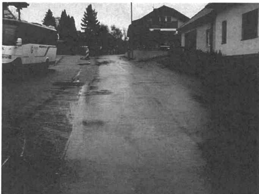
Slika 7: Rekonstrukcija občinske ceste v Kuzmi

Podrobno bo opredelitev po sprejetju odločitve o porabi teh sredstev.