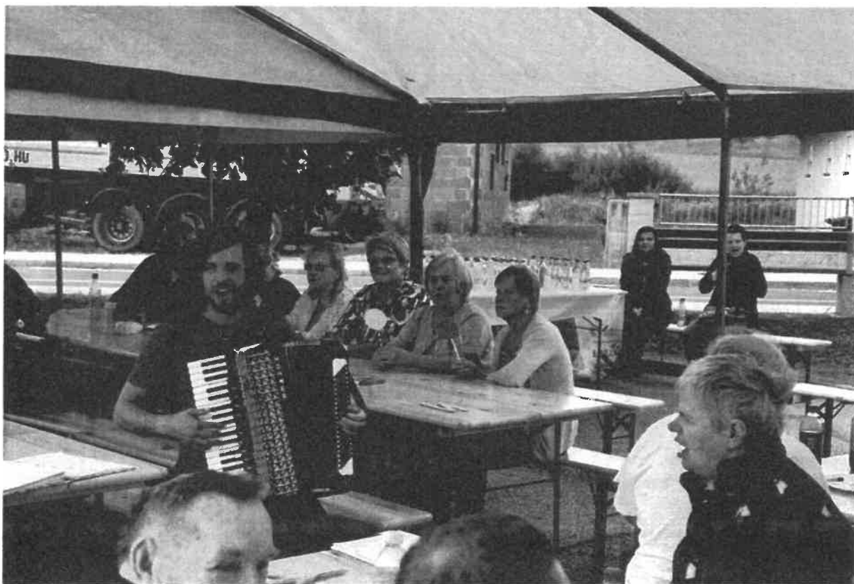
Slika 6: Utrinek iz delavnic projekta Sožitja.