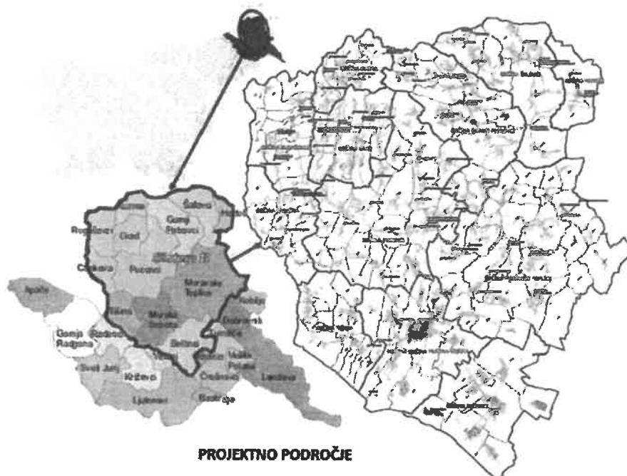
Slika 4: Projektno obdobje nadgradnjaj vodovod sistema B