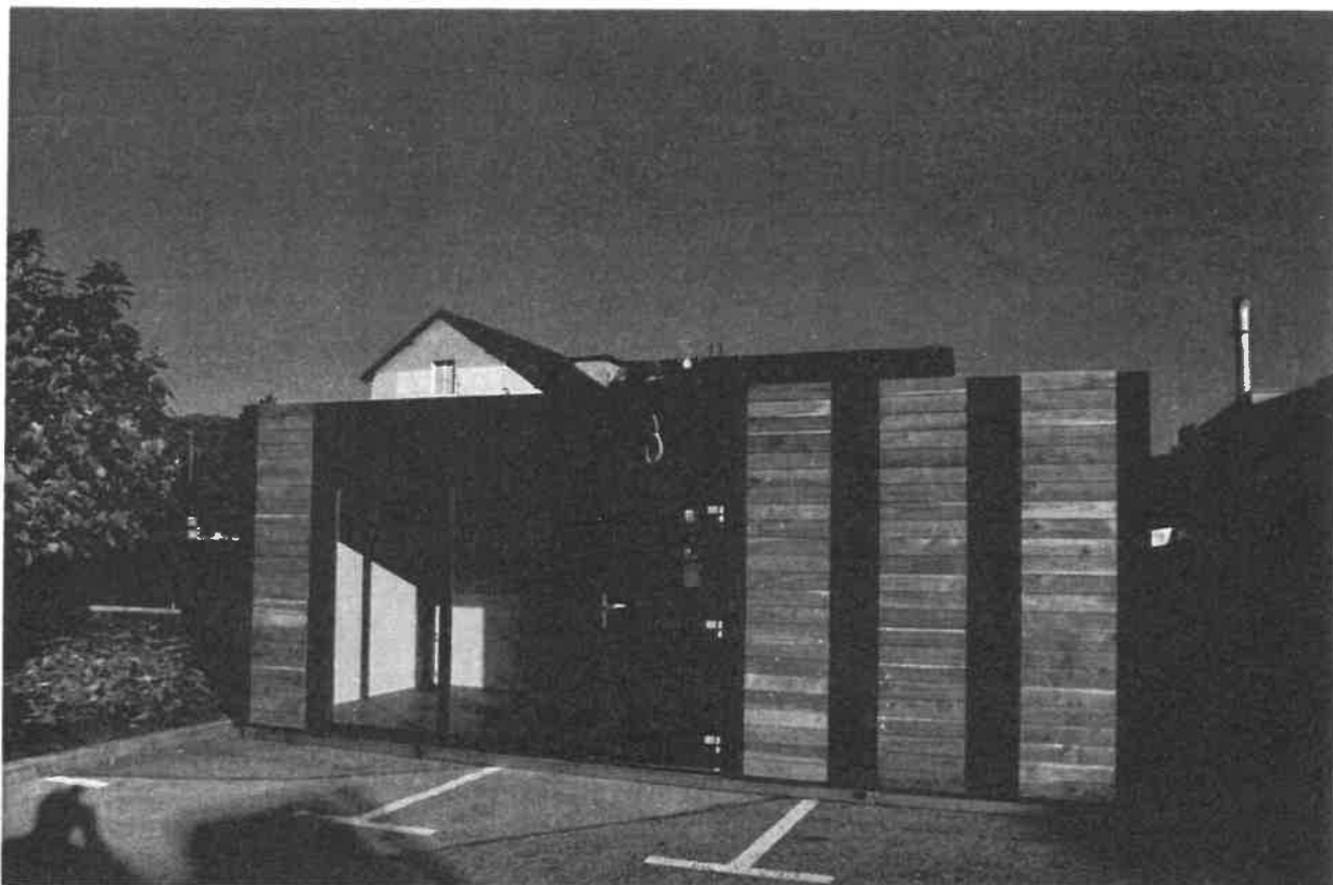
Slika 5: Mobilna hiška-projekt Sožitje