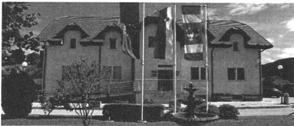
Slika 1: Sedež občinske uprave

Občina Kuzma je ena od občin v Republiki Sloveniji na Goričkem delu Prekmurja. Občina Kuzma leži na Goričkem, na skrajnem severovzhodnem gričevnatem delu Slovenije ob tromeji Slovenije, Avstrije in Madžarske. Na območju občine, v Trdkovi, se nahaja piramidasti tromejni kamen iz leta 1924. Vsaka stran piramide nosi grb ene od mejnih držav, obrnjen v smeri te države, ter letnico določitve državne meje (10. september 1919 in 4. junij 1920). Tromejnik je 31. maja 1924 na sedanjo mesto postavila mednarodna razmejitevna komisija. S Trianonsko mirovno pogodbo 4. junija 1920 je bilo Prekmurje dokončno vključeno v jugoslovansko državo. Do tromeje vodi turistična pot v obmejnem delu občine Kuzma in krožna naravoslovna učna pot, ki je sestavljena iz 13 postaj, med katerimi nas skozi gozd vodi ježek. Gozdna učna pot je dolga 2600 m, kar je približno eno uro in pol hoje. Objekti na poti so opremljeni tako, da lahko uporabite vsa svoja čutila. Dostop pa je tudi iz drugih dveh držav. V Kuzmi imajo spominski park v spomin pripadnikom Teritorialne obrambe RS in policije, ki so leta 1991 sodelovali v bojih za osamosvojitve Republike Slovenije in ubranili mednarodni mejni prehod Kuzma ter zavzeli stražnico v Kuzmi. Od sakralnih objektov so pomembni predvsem cerkev sv. Kozme in Damjana v Kuzmi, posvečena zdravniškima zavetnikoma in poslikana s freskami, Evangeličanska cerkev, Gornji Slaveči, številne kapelice ter domačija Cecilije Bežan na Gornjih Slaveč z dimno kuhinjo in pokrita s slamo.