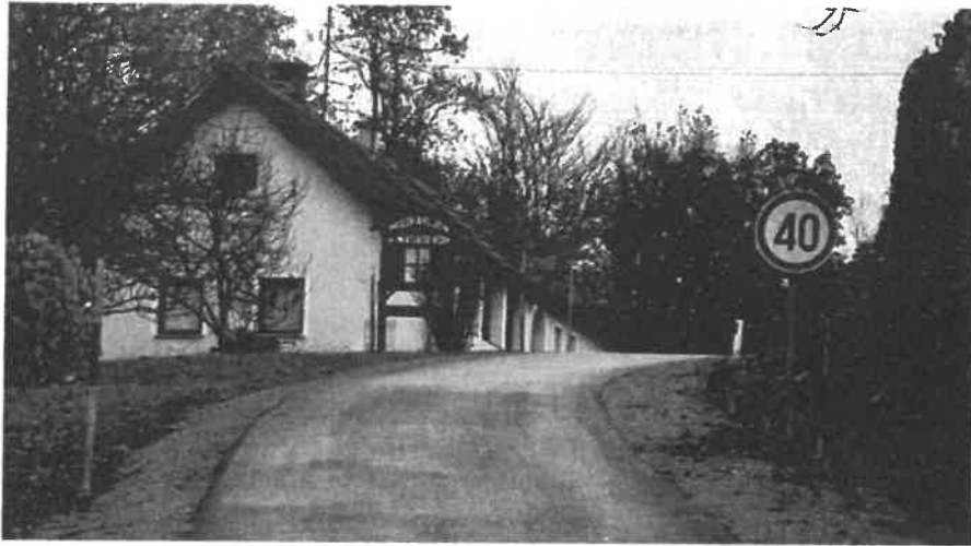
Slika 8: Rekonstrukcija občinske ceste v Matjaševcih