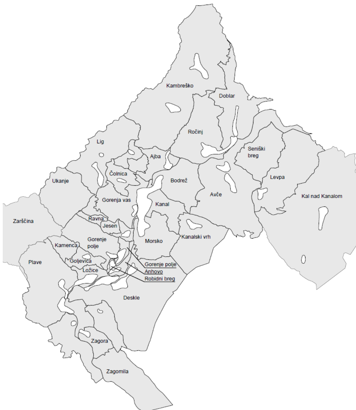
Prikaz pokritosti naselij z območji javnega vodovoda

Območja javnega vodovoda večinoma obsegajo območje enega naselja, deloma ali v celoti. Izjemoma lahko pokriva območje javnega vodovoda več naselij ali pa je območje enega naselja pokrito z območji več javnih vodovodov. Število območij javnega vodovoda sovpada s številom vodovodnih sistemov.