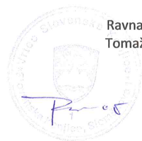
Ravnatelj vrtca Tomaž Popović