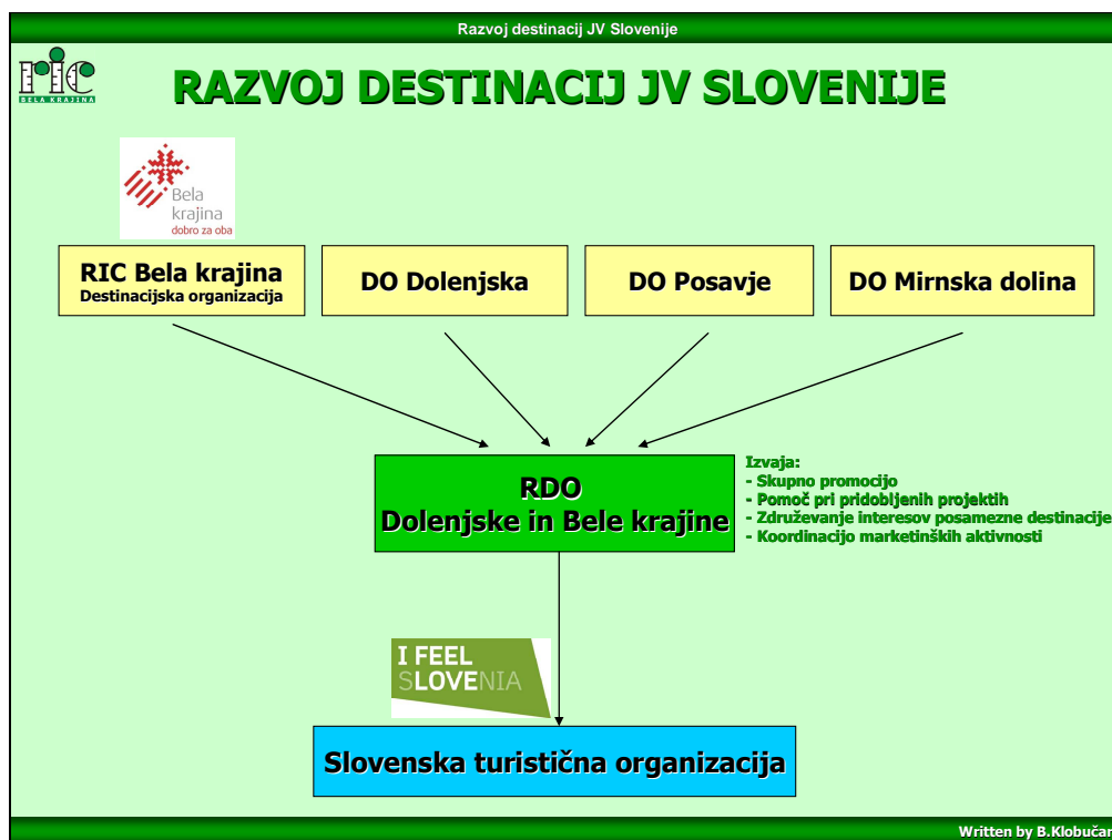
Slika 2: Predlog organiziranosti upravljanja turizma na regionalni ravni

Le z enotno organiziranostjo na lokalni ravni (Bela krajina), bomo lahko uspešno nastopali in vzdrževali partnerski odnos v regiji. Spodnja slika prikazuje predlagano organiziranost na regionalni ravni, kjer RIC Bela krajina lahko izkazuje prednost pred ostalimi in je kot primer dobre prakse organiziranosti destinacijske organizacije, seveda, pod predpostavko, da tudi Občina Metlika potrdi enotno destinacijsko organizacijo oziroma najdemo skupno sprejemljivo rešitev delovanja po enotno destinacijsko organizacijo.