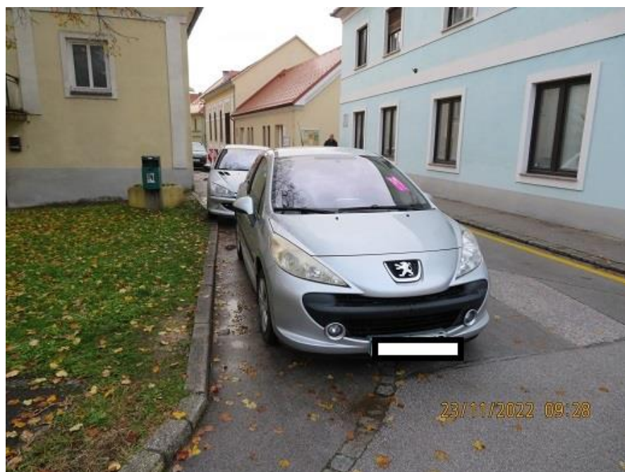
Napačno parkirana vozila