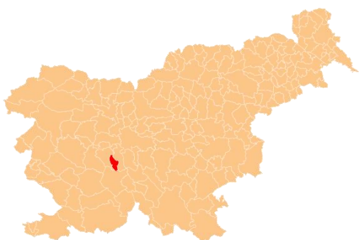
Slika 2: Lega občine Borovnica

Ozemlje občine se na severu široko odpira na Ljubljansko barje, na vzhodu in JV se strmo vzpenja na Rakitniško planoto, na Z in JZ pa na Menišijo. Od slovenske prestolnice je oddaljena 20 km in leži ob 5. vseevropskem prometnem koridorju. Skozi občino poteka trasa evropsko pomembne železniške proge Dunaj/Budimpešta-Ljubljana-Trst/Koper. Na železniški postaji v Borovnici ustavljajo vsi potniški vlaki, tudi hitri (ICS) in mednarodni vlaki. Do priključka na avtocesto A1 (Ljubljana – Koper/Trst) je iz občinskega središča 10 km. Z Vrhnike in iz Ljubljane je Borovnica dostopna po regionalni cesti R3 642 Vrhnika - Podpeč – Ig – Ljubljana, ki v dolžini 7 km poteka skozi občino od gradu Bistra do konca naselja Pako. Kljub svoji, v skrajni JZ obronek Ljubljanskega barja pomaknjeni legi, slabi navezovalni regionalni cestni povezavi in dejstvu, da je z eno izmed sosednjih občin oz. občino Cerknica povezana samo z gozdnimi cestami, ima - širše gledano - občina relativno ugodno prometno lego.