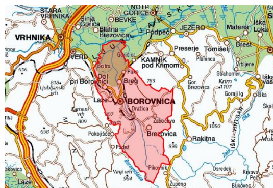
Slika 3: Obseg občine Borovnica