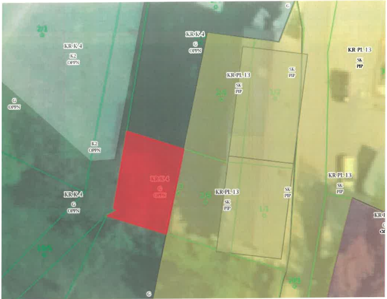
parc. št. 2/8 k. o. 2122 - Huje