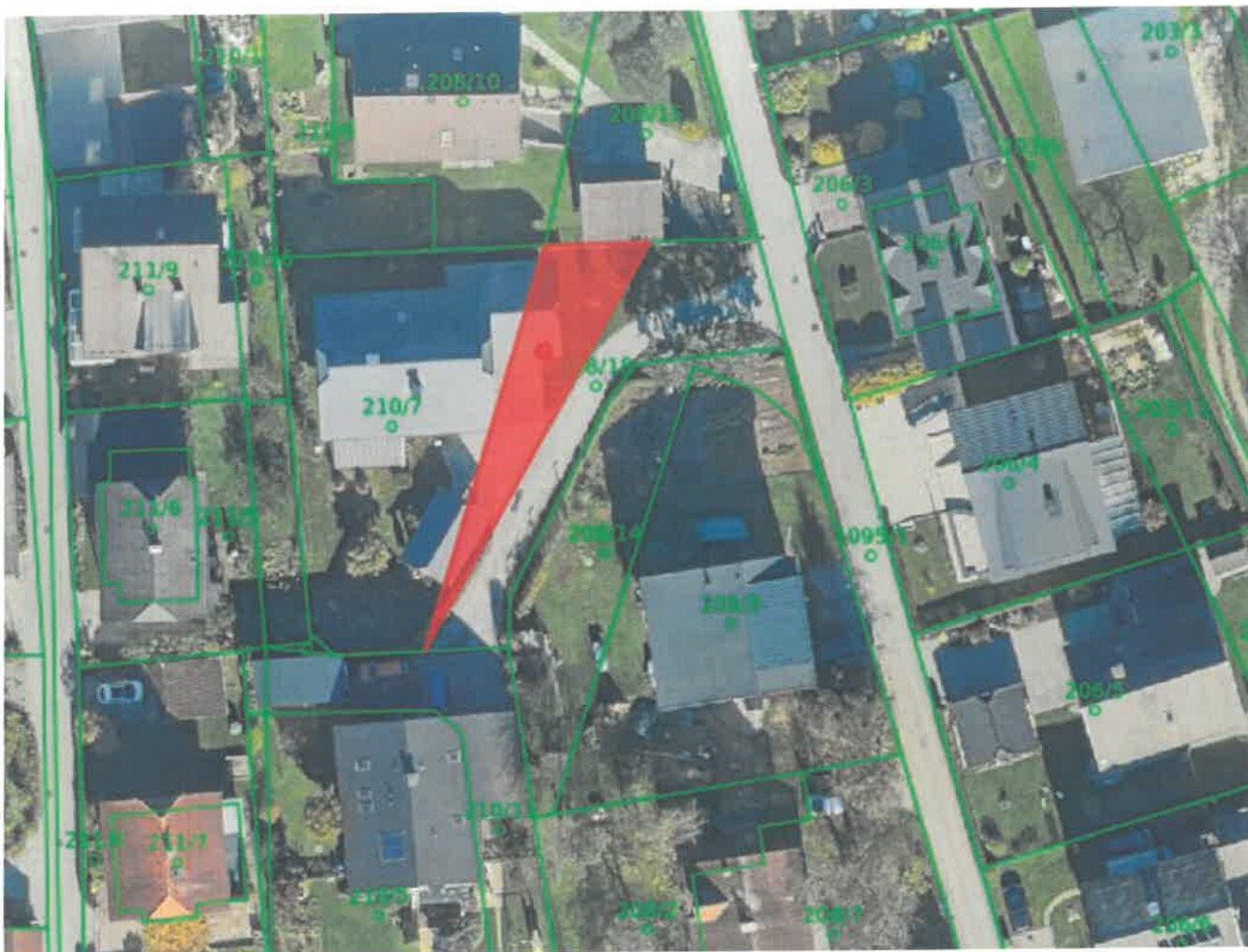
parc. št. 208/19 k. o. 2120 - Primskovo