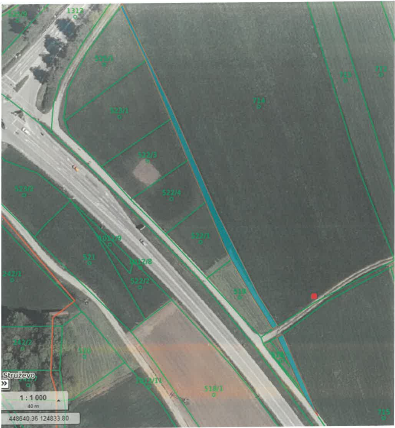
Parc. št. 1013/1 in 1013/2 k.o. Kranj