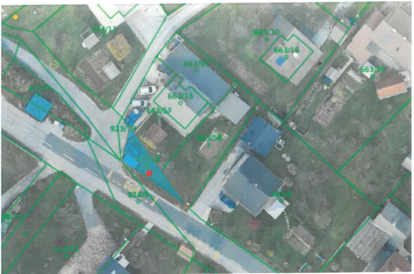
parc. št. 923/18 k. o. 2128 – Zgornja Besnica