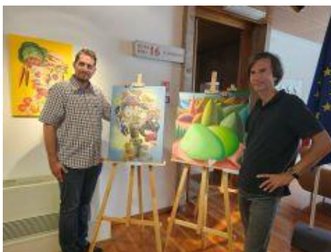
Utrinek iz razstave: Drobcu delcev

Ob mednarodnem dnevu gluhih je Medobčinsko društvo gluhih in naglušnih za Gorenjsko AURIS Kranj, v sodelovanju z MOK v galeriji MOK pripravilo razstavo z naslovom Drobcu delcev, ki je plod ustvarjalnosti dveh gluhih akademskih slikarjev. Novica je bila objavljena tudi na komunikacijskih kanalih MOK. Celoten dogodek je bil pretolmačen v znakovni jezik in opremljen s slušno zanko.