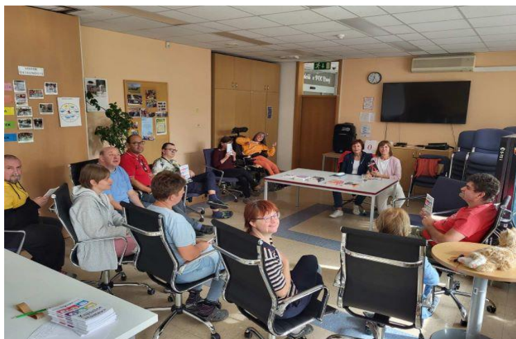
Bralni klub uporabnikov VDC v sodelovanju z Mestno knjižnico Kranj

Društvo paraplegikov Gorenjske je v letu 2023 organiziralo ustvarjalne delavnice, kjer so se lotili raznih ročnih spretnosti in izdelovanja voščilnic. Na dan državnosti so izvedli likovno delavnico v prostorih društva s strokovnim mentorjem pod pokroviteljstvom JSKD. Slikarjem društva so omogočili sodelovanje na raznih slikarskih delavnicah.