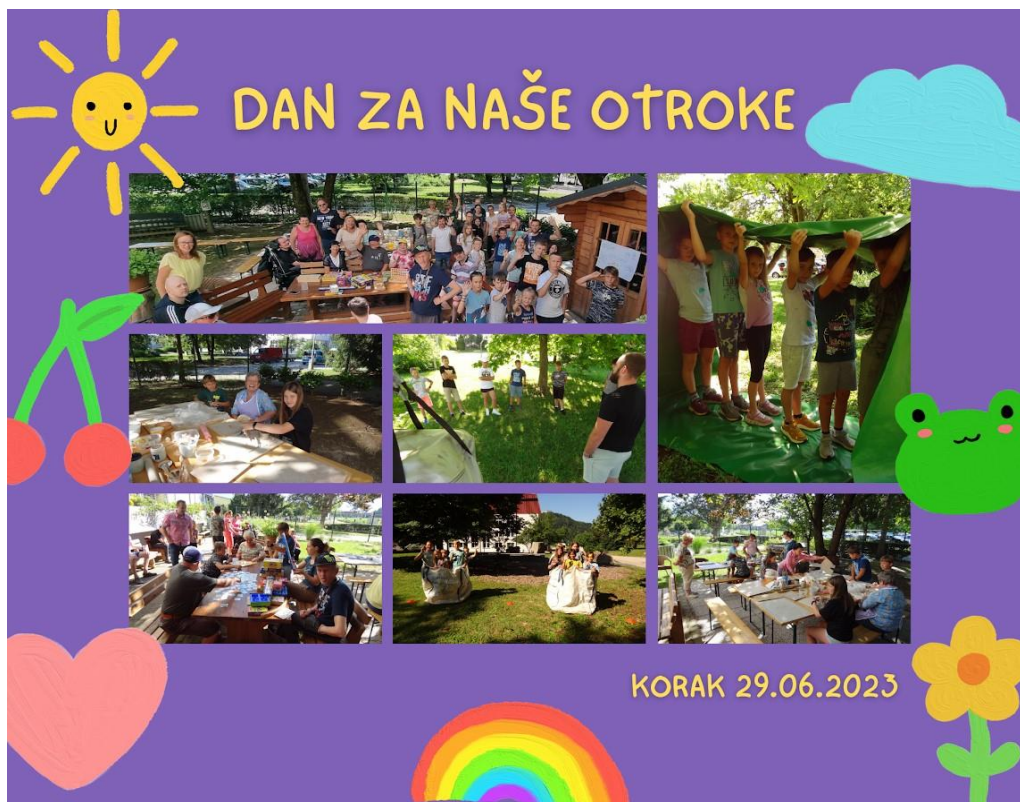
Dogodek »Dan za naše otroke«

Organizirali so dogodek »Dan za naše otroke«, katerega namen je ozaveščanje mladih o pomembnosti sprejemanja drugačnosti, medgeneracijsko povezovanje in trening socialnih veščin njihovih uporabnikov, se je v letu 2023 vključilo 19 otrok. Od tega 8 otrok/vnukov uporabnikov in 11 otrok zaposlenih. Izvajale so se skupinske povezovalne igre, kreativne delavnice z glino in risanjem, športne in družabne igre.