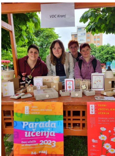
Uporabniki VDC na dogodku Parada učenja

Uporabniki Varstvenega delovnega centra Kranj so maja 2023 sodelovali na dogodku Parada učenja, na katerem so predstavili zaposlitev pod posebnimi pogoji, ustvarjalno delavnico s prikazom izdelovanja enostavnih izdelkov iz gline.