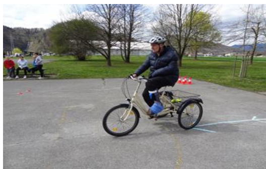
Športne aktivnosti v centru

Del dolgotrajne rehabilitacije v Centru Korak, Kranj je tudi rehabilitacija s pomočjo športnih aktivnosti. Uporabnikom omogočajo, da se lahko vključujejo v sledeče aktivnosti: športno plezanje (Plezarna Britof), kolesarjenje (poligon, krajše razdalje, daljše relacije), plavanje (Kranjski bazen), nordijska in terapevtska hoja (Brdo pri Kranju in okolica), namizni tenis, kegljanje (zdravilni vrt centra), košarka, badminton, zimski športi... Organizirali in izvedli so pet-dnevni poletni tabor v Pineti (Hrvaška)- vključujoč plavanje in socialno vključevanje, uporabnikom storitve omogočajo uporabo fitnes naprav prilagojenih osebam z invalidnostjo in jih usposablajo za varno vožnjo s triciklom.