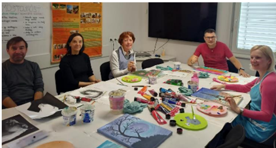
Utrinek iz slikarske delavnice