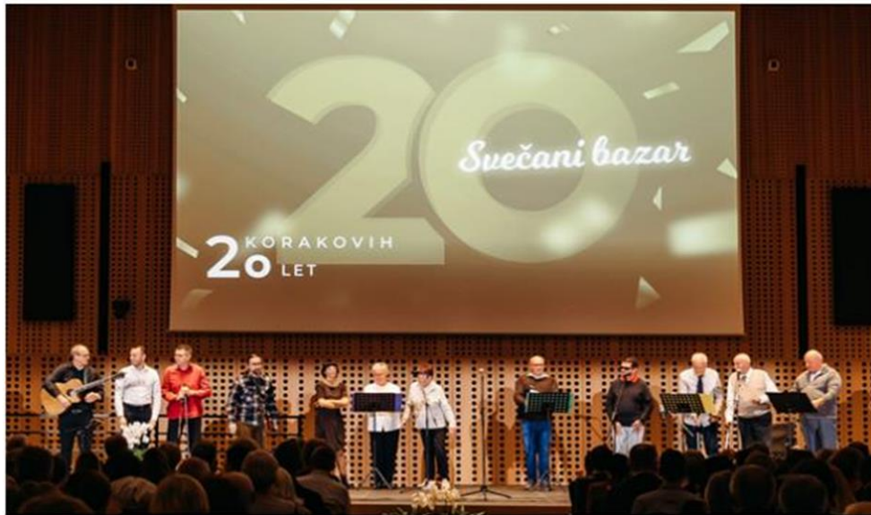
Utrinek s svečanega bazarja ob 20 letnici delovanja

pridobljeno možgansko poškodbo v Centru Korak in izdelkov zaposlenih invalidov na zaščitene delovnih mestih, zaposlenih v Zaposlitvenem centru Korak. Dogodek je bil zelo uspešen in odmeven.