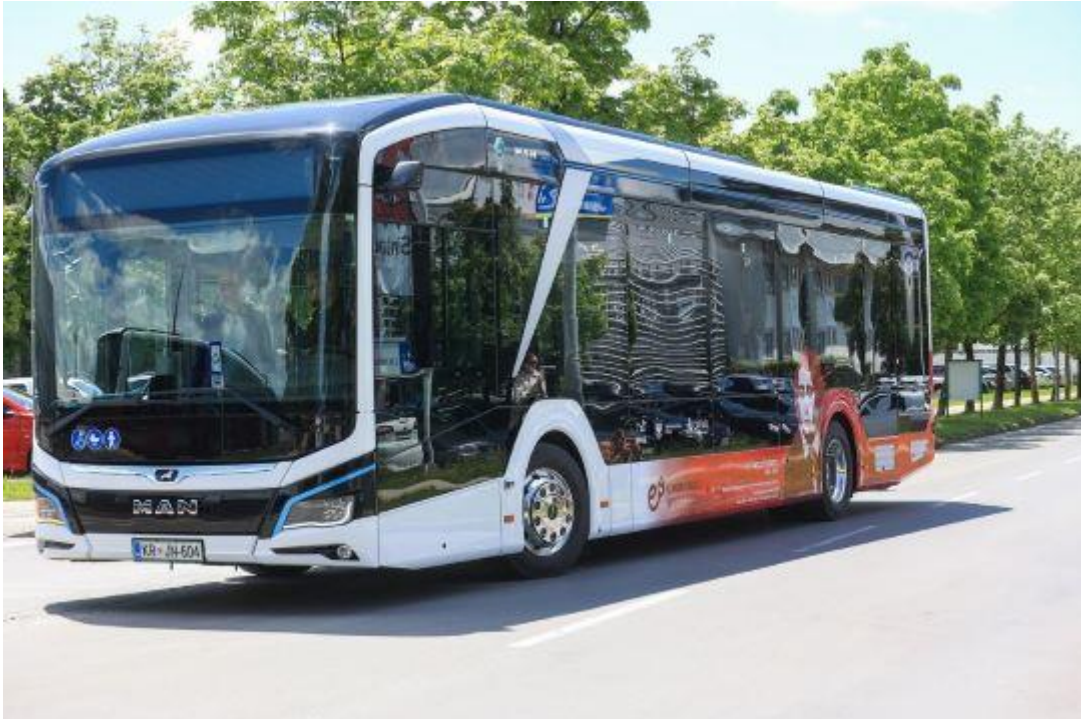
Električni avtobus vključen v promet v maju 2023

saj so na ta način želeli čim več uporabnikom omogočiti vožnjo z novimi avtobusi. Vozniki avtobusov so opravili izobraževanje glede pravilne uporabe in oskrbe s potniki z oviranostmi, da bi zagotovili varno in udobno vožnjo za vse potnike.