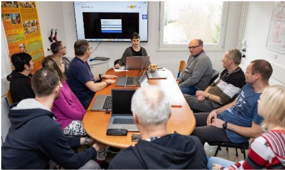
Utrinek s projekta DiGi-scena

Uporabnikom omogočajo uporabo prilagojene računalniške opreme in krepijo digitalno pismenost.