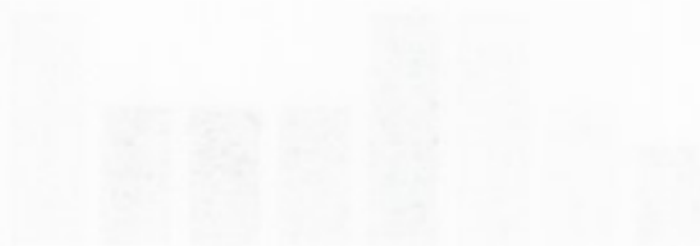
Appendix B: Interview schedule