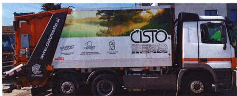
Fotografija 12 in 13: Smetarska vozila