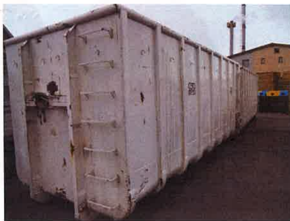
Fotografija 10 in 11: Kovinski kontejnerji