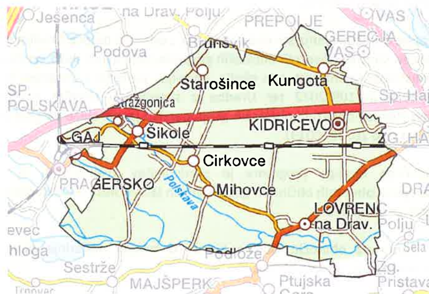
Slika 1: Zemljevid občine Kidričevo