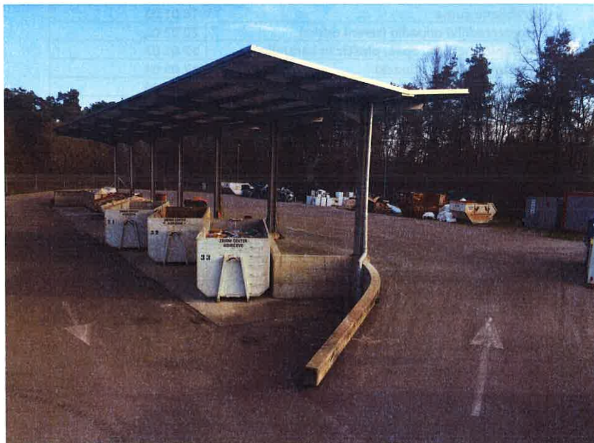
Fotografija 1: Zbirni center Kidričevo

Datumi obratovanja zbirnega centra bodo navedeni na koledarju odvoza odpadkov ter na spletni strani https://cistomesto.si/zbirni-centri/ .