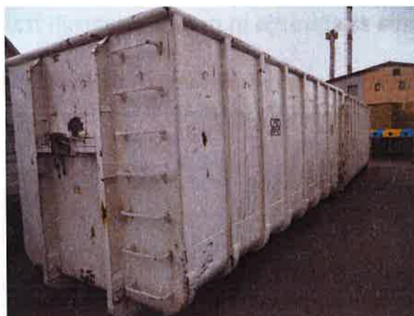
Fotografija 15 in 16: Kontejnerji različnih volumnov za zbiranje kosovnih in drugih odpadkov