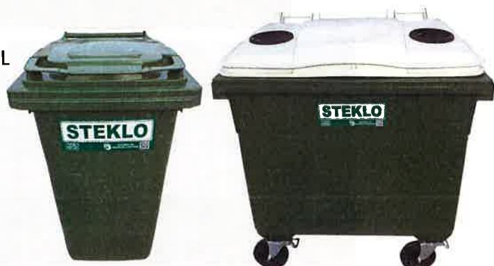
Fotografija 8 in 9: Posode za zbiranje stekla (steklene embalaže)