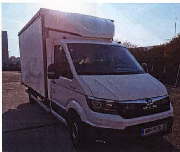
Fotografija 18: Vozila za prevoz in zbiranje nevarnih odpadkov

Za zbiranje in prevoz nevarnih frakcij uporabljamo specialna vozila, s pokritim kesonom in dovoljenjem za prevoz nevarnih snovi.