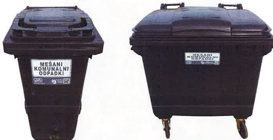
Fotografija 2 in 3: Posode za mešane komunalne odpadke