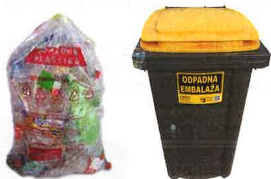
Fotografija 7: Vrečka za mešano embalažo

Za zbiranje steklene embalaže, uporabljamo plastične zabojnike, volumnov 240 l in 1100 l in sicer: