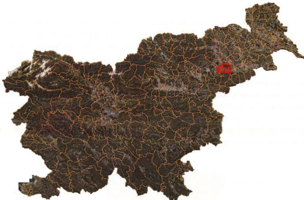
Slika 2: Lega občine Kidričevo