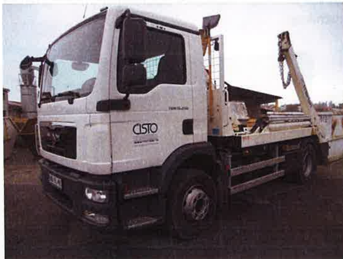
Fotografija 14: Vozilo za prevoz kontejnerjev

Za zbiranje in prevoz odpadkov iz zbirnih centrov, uporabljamo specialna komunalna vozila za odvoz kontejnerjev večjega volumna: