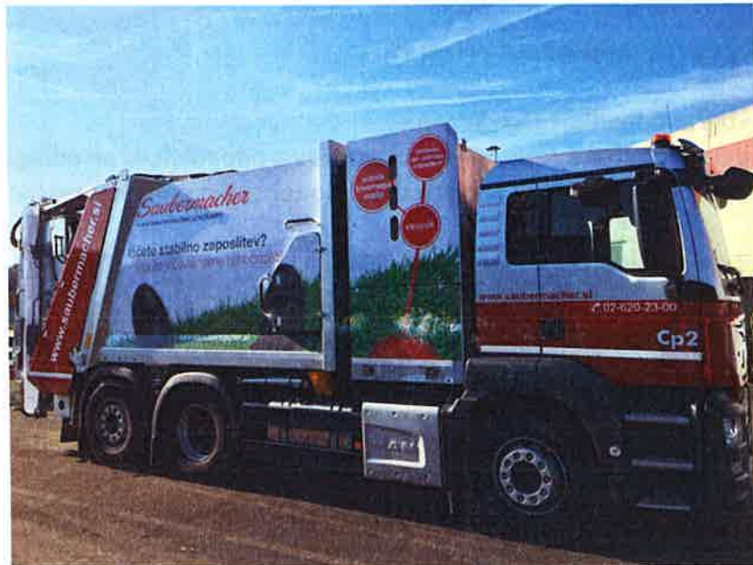
Fotografija 19: Vozilo za pranje zabojnikov za zbiranje bioloških odpadkov