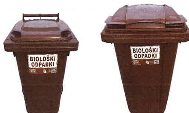
Fotografija 4: Posode za biološke odpadke