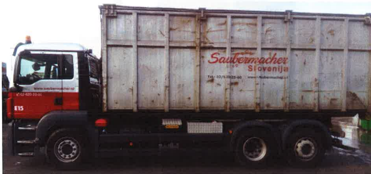
Fotografija 17: Vozilo za prevoz kotalnih prekucnikov

Za prevzemanje in prevoz kosovnih odpadkov uporabljamo kontejnerska vozila ter vozila za prevoz kotalnih prekucnikov.