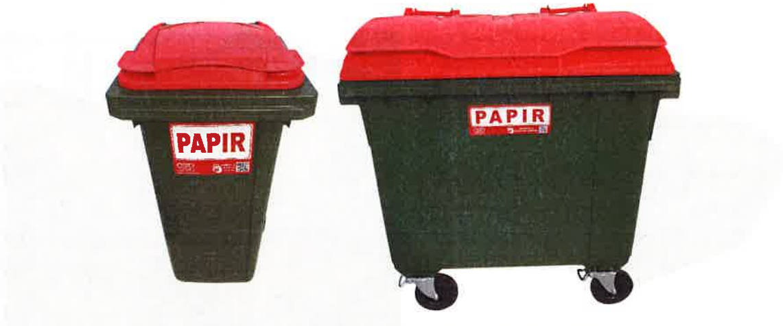
Fotografija 5 in 6: Posode za zbiranje papirja

Za zbiranje plastične embalaže ter ločenih frakcij iz plastike bomo uporabljali: