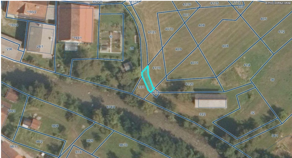
Slika 3: zemljišče parc. št. 867/7 k. o. 942 Gornji Grad