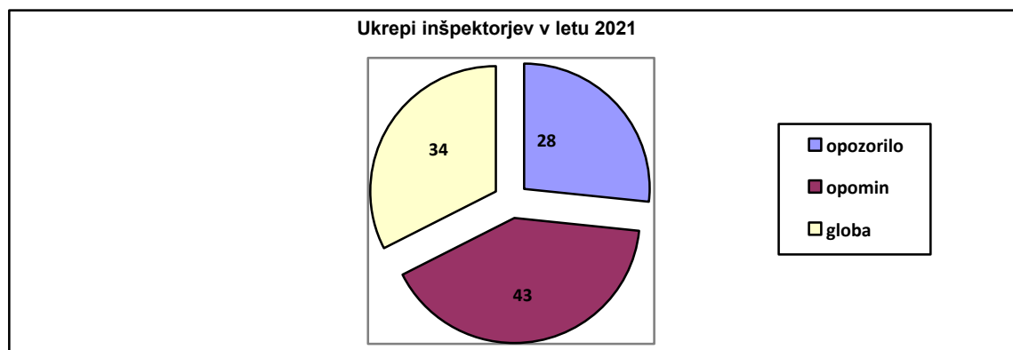
Grafikon 3: Izrečeni ukrepi inšpekcije v letu 2021