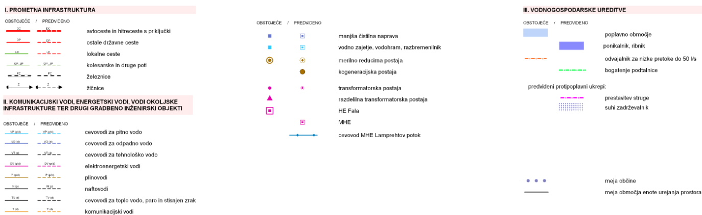
Slika 2: Izsek iz OPN.