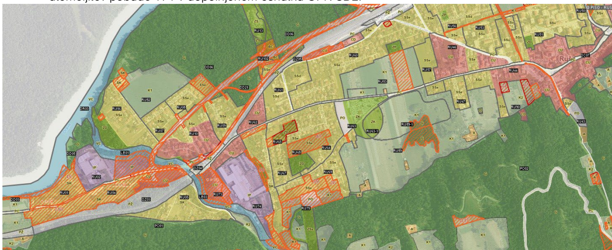
Slika 3: Izsek iz dopolnjenega osnutka OPN SD2 s prikazom podrobnejše namenske rabe zemljišč in pobud.