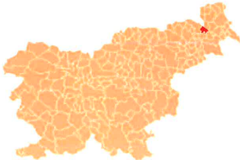
Slika 2: Lega Občine Radenci v Republiki Sloveniji