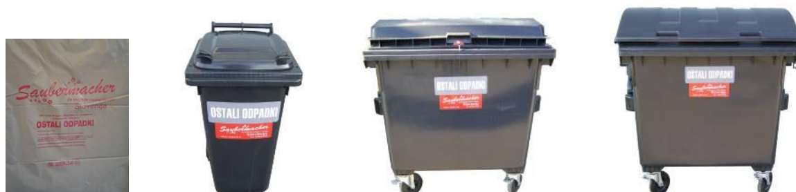
Slika 3 : Namenska embalaža za zbiranje mešanih komunalnih odpadkov