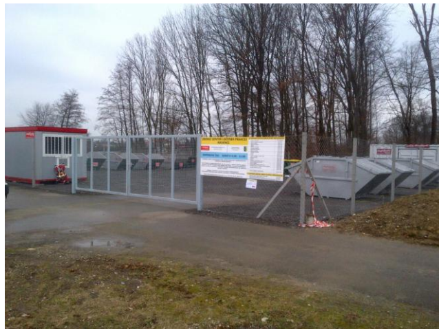
Slika 9 : Zbirni center ločenih frakcij Radenci

Zbirni center ločenih frakcij se nahaja v naselju Boračeva, na lokaciji pri stari žagi, parc. št. 55/3 in 55/5, k.o. Boračeva.