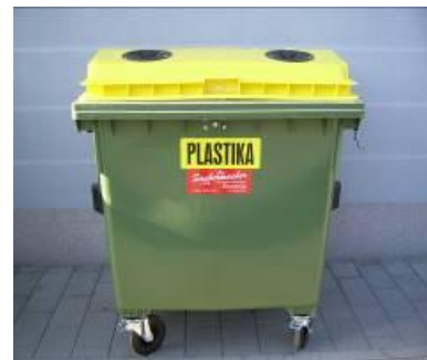
Slika 5 : Namenska embalaža za zbiranje plastične, kovinske, sestavljen in mešane embalaže