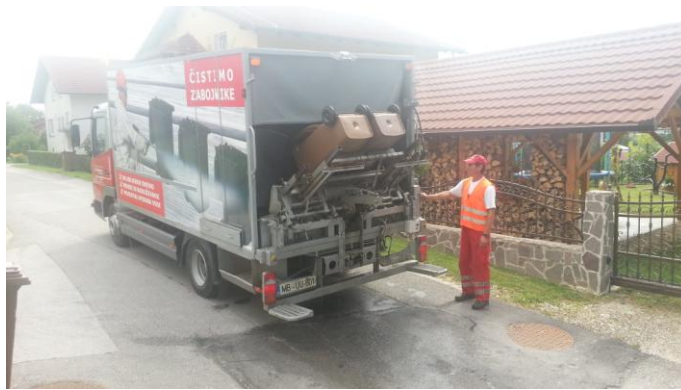
Slika 11 : Vozilo za pranje zabojnikov za zbiranje odpadkov