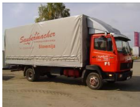
Slika 7 : Namenska embalaža in specialno vozilo za zbiranje kosovnih odpadkov