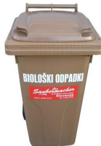
Slika 6 : Namenska embalaža za zbiranje biorazgradljivih odpadkov