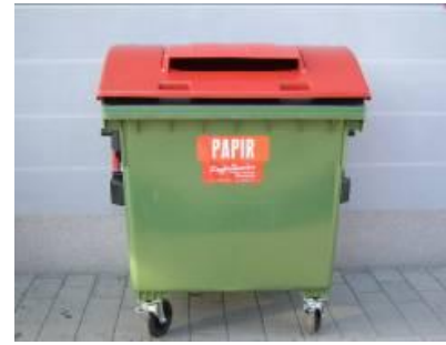
Slika 4 : Namenska embalaža za zbiranje papirja in papirne embalaže