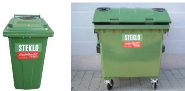
Slika 8 : Namenska embalaža za zbiranje steklene embalaže