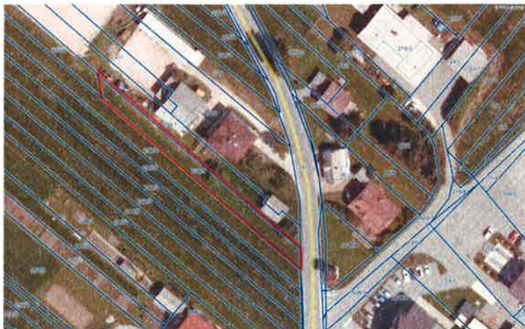
PARCELA ŠT. 155 K.O. K.O. 1683 NOVA VAS