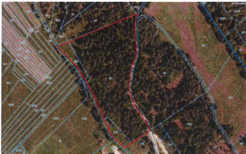
PARCELE ŠT. 1/112, 1/111, 1/110, 1643/1, 1639 k.o. 1683 Nova vas