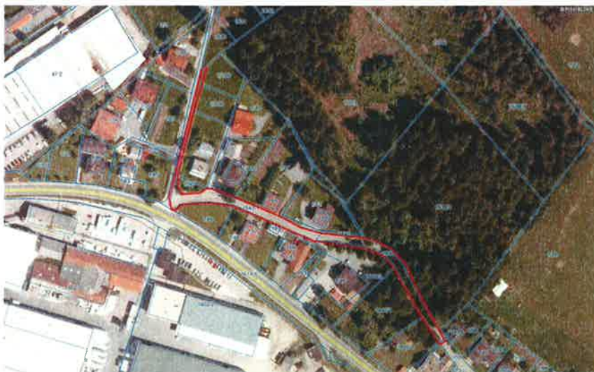
PARCELI ŠT. 273 IN 274 k.o. 1683 Nova vas