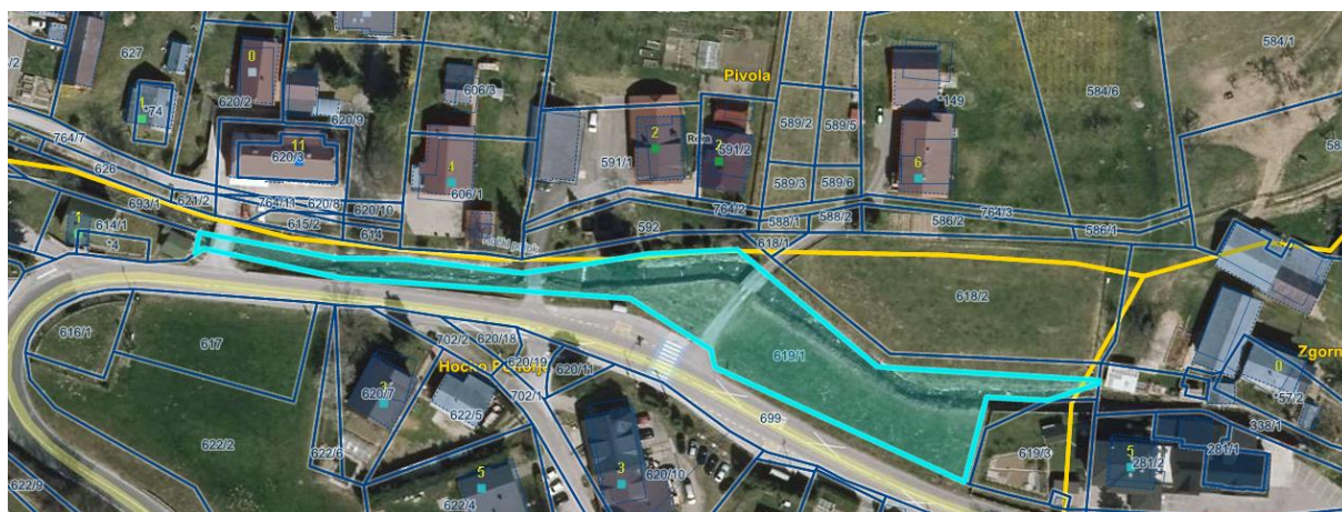
Grafični prikaz parc. št. 619/1, k.o. Hočko Pohorje.

Predmetna nepremičnina v naravi predstavlja obcestni pas ob državni cesti RT 1322 – Hoče – Pohorska vzpenjača, del vodotoka in del travnika.