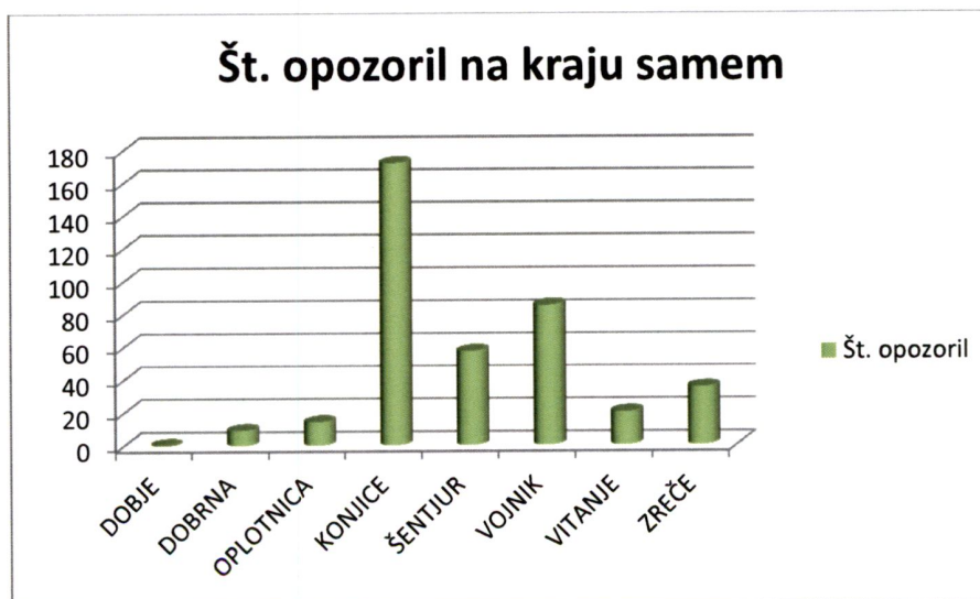
Slika št. 2: Število izrečenih opozoril občinskih redarjev po vseh občinah – mirujoči promet