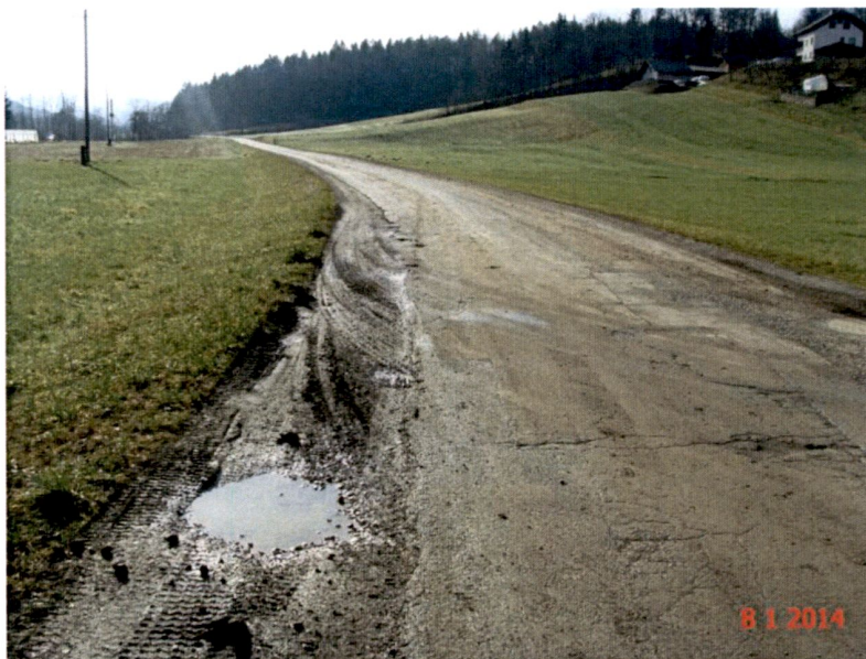
Slika 3: Onesnaženje oziroma poškodba občinske ceste.

Kontrolirali smo tudi izvajanja drugih aktivnosti na prometnih in drugih javnih površinah, za katera si je s strani pristojnega organa občine potrebno pridobiti predhodno soglasje, kot na primer prodajo blaga na premičnih stojnicah v času prvega novembra ter podobnega.