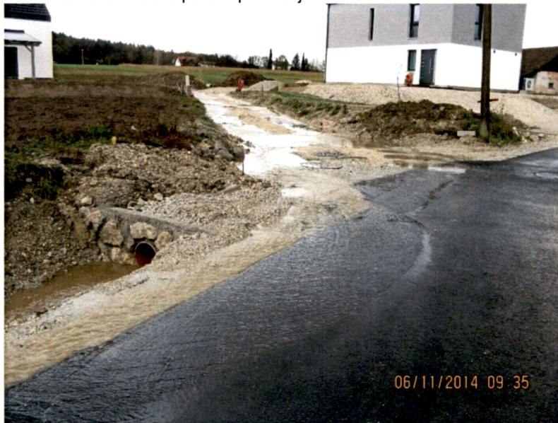
Slika 2: Izvajanje del na cestišču občinske ceste.

Nadzirali smo posege na cesti oziroma njenem varovalnem pasu, kjer opažamo, da so ljudje vedno bolj osveščeni in si v večini primerov predhodno pridobijo ustrezno soglasje. Problem ostaja predvsem tam, kjer kategorizirana občinska cesta še vedno poteka po zemljiščih v zasebni lasti.