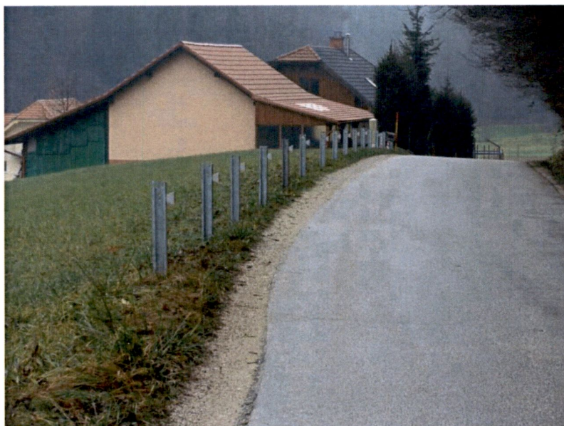
Slika 4: Postavitev količkov brez soglasja.

Prav tako smo sodelovali pri prometnih ureditvah, podajali smo predloge in pripombe na odvečno, pomanjkljivo ali neustrezno prometno signalizacijo, ki smo jo pri opravljanju vsakodnevnih nalog opazili.