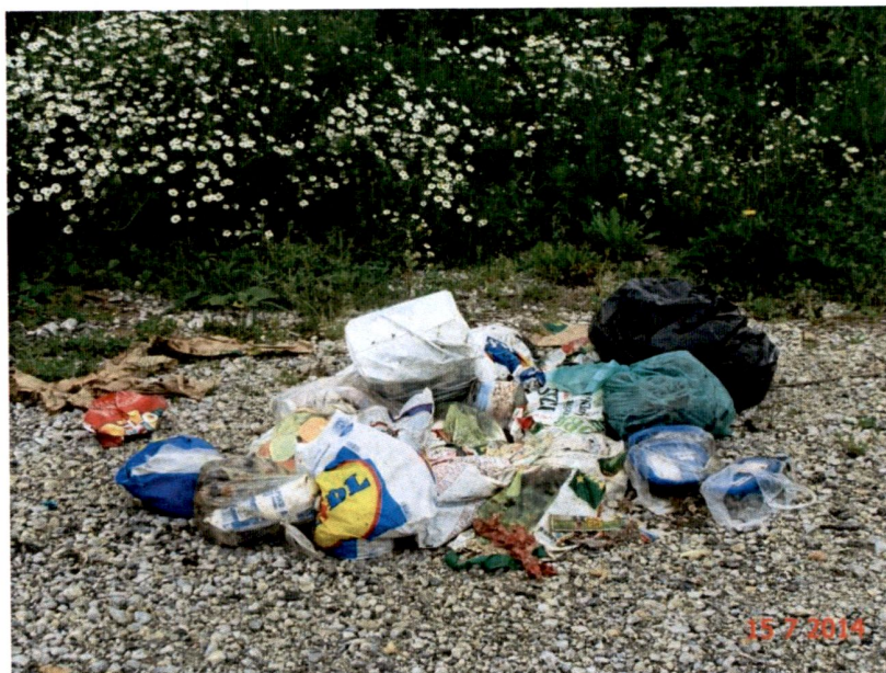
Slika 5: Nepravilno ravnanje z odpadki.

Z nadzorom nad pravilnim ravnanjem ter odlaganjem odpadkov se bo nadaljevalo tudi v prihodnje, z namenom, da se ugotovi, ali in v kolikšni meri uporabniki upoštevajo določila občinskih odlokov o zbiranju in prevozu komunalnih odpadkov. Z nadzorom bi želeli tudi prispevati k drugačnemu razmišljanju tistih, ki še vedno nepravilno odlagajo odpadke.