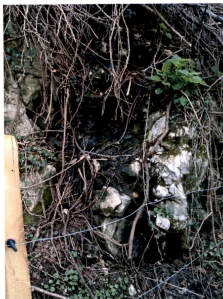
Slika 6: Odvajanje odpadnih komunalnih voda.

Na območju Občine Vojnik se je tako kot v preteklem obdobju izvajal nadzor nad lastniki psov oziroma njihovo uporabo vrečk ter čistilnega pribora za pobiranje pasjih iztrebkov. Nadzor uporabe vrečk se je izvrševal po samem centru Vojnika in v okolici osnovnih šol. Pri tem nadzoru je bilo ugotovljeno, da lastniki psov uporabljajo vrečke in se s tem stanje posledično izboljšuje.