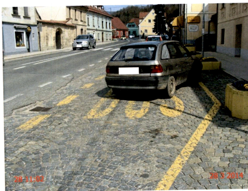
Slika 1: Nepravilno parkirano vozilo.

S strani občinskega redarstva je bilo na področju Občine Vojnik izdanih 85 (85) opozoril na kraju samem (to pomeni, da je bil ob prihodu lastnika vozila izrečeno ustno opozorilo in vozilo odmaknjeno). Na področju parkiranja in ustavljanja je bilo izdanih 28 (26) plačilnih nalogov .