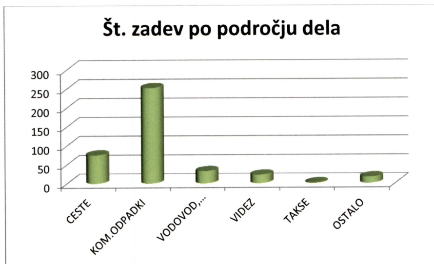
Slika 1: Število zadev inšpektorjev po področjih za vse občine

V pristojno reševanje ostalim inšpekcijskim službam je bilo odstopljenih 9 (5) zadev.