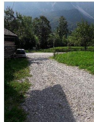
območje predlagane širitve