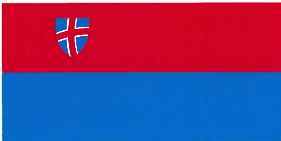
Zastava Občine Piran