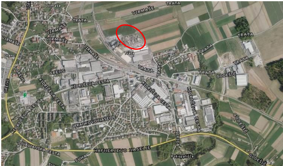
Slika 1: Prikaz lokacije na ortofoto posnetku

Na severni strani območje OPPN meji na Sorško polje, na vzhodni strani na javno pot (oznaka JP 902992), na zahodni in južni strani pa na pozidano območje proizvodnega kompleksa podjetja Knauf Insulation.