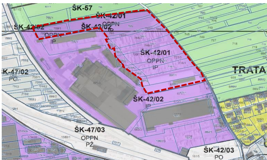
Slika 2: Prikaz območja EUP ŠK-42/01 na grafičnem delu OPN (namenska raba)

Območje OPPN ŠK-42/01 je določeno z OPN in zajema zemljišča z naslednjimi parcelnimi številkami: 689/1, 689/3, 697/1, 697/2, 716/1, 716/2, 723/3, 723/4, 730/1, 730/2, 746/1, 746/2, 760/4, 765, 766/1, 766/2, 785/1, 787/4 in 789/1, vse k.o. Stari Dvor (2029), v skupni površini cca. 3,3 ha.