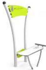
SIT UP BENCH