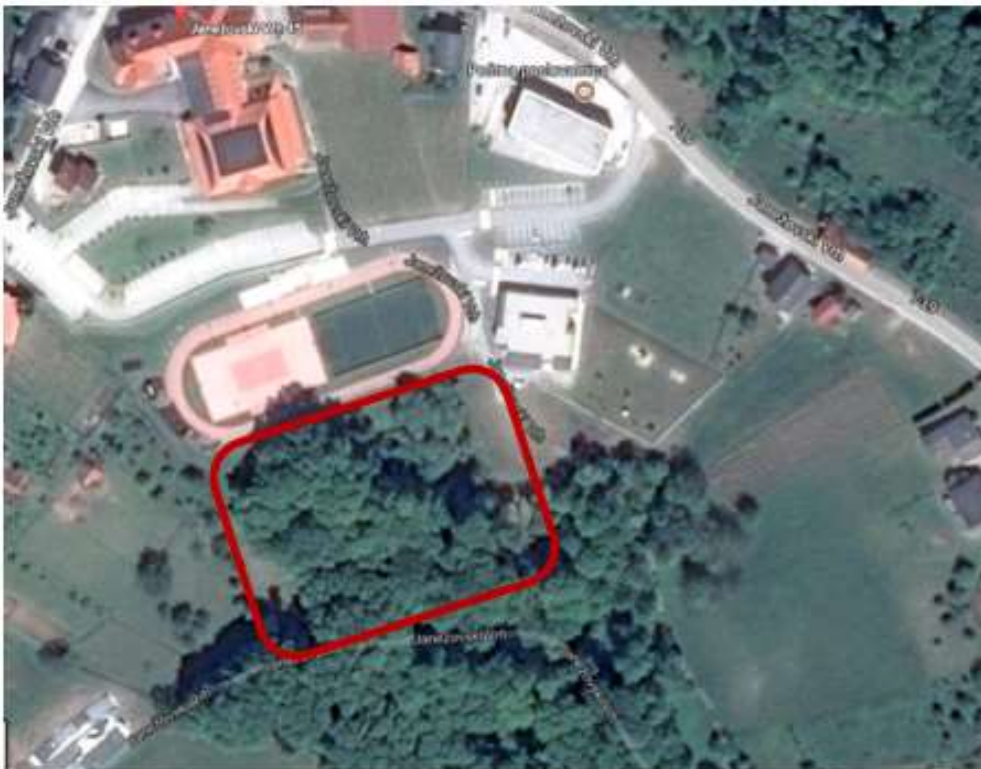
Slika 6-3: Lokacija umestitve investicije