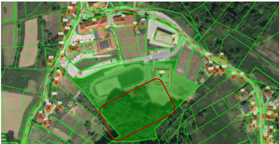
Slika 8-1: Grafični prikaz lokacije

Naložba se bo izvedla v k.o. Janežovski Vrh na parcelni številki 56/1.