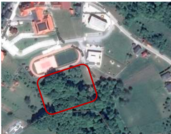
Slika 3-3: Obstoječe stanje lokacije predvidene investicije

Občina Destrnik že ima v lasti ustrezno zemljišče, kjer bi se tak center za druženje v naravi lahko razvil in kjer bi se lahko izvajale načrtovane vsebine. Predvidena lokacija projekta se nahaja pod občinskim centrom v neposredni bližini osnove šole in vrtca ter pod že urejenim športnim igriščem. Območje omejujejo naslednje enote: na severu kompleks športnih igrišč in vrtec s parkirišči, na vzhodu travnato pobočje, ki se spušča v dolino, na jugu gozdnata dolina in na zahodu gozdnata pobočje, ki se spušča v dolino. Teren je vzhodno od vrtca umetno izravnani v obliki teras na katerih se nahaja otroško igrišče. Teraso so utrjene s kamnitimi škarpami. Osrednji del območja, ki je predmet projekta, predstavlja gozdat teren, ki se spušča v dolino. Območje je idealno za vzpostavitev centra za druženje več generacij ob ponudbi športno rekreativnih in kulturnih vsebin, vendar ga je potrebno ustrezno urediti.