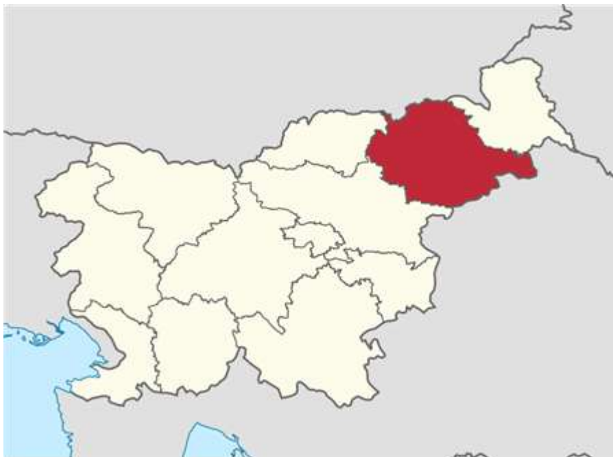
Slika 3-1: Umestitev Podravske regije v prostoru Republike Slovenije