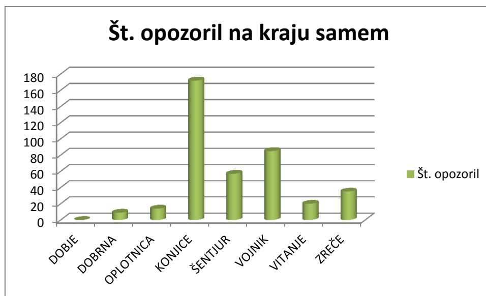
Slika št. 2: Število izrečenih opozoril občinskih redarjev po vseh občinah – mirujoči promet