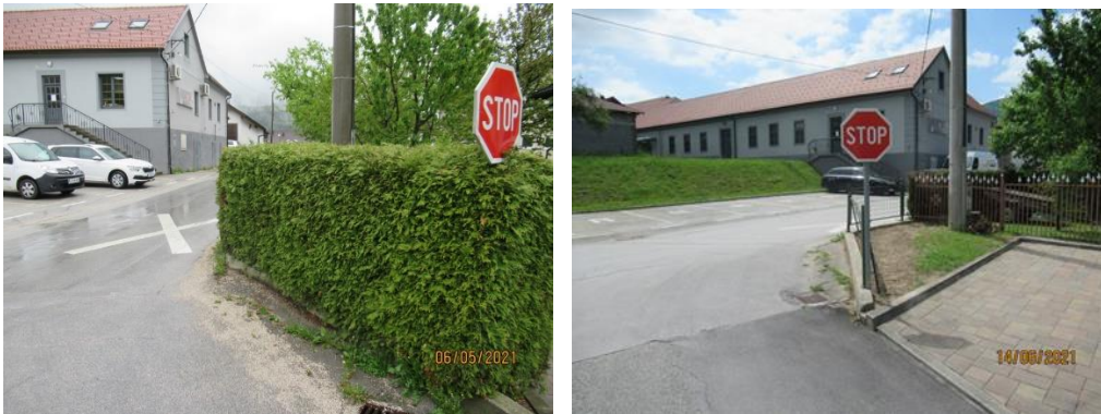
Slika 2 in 3: Vegetacija v križišču občinskih cest in stanje po ureditvi

Na področju zapuščenih in izrabljenih vozil so v letu 2021 obravnavali 2 primera, kjer so lastniki po izdani odredbi vozila sami odstranili.