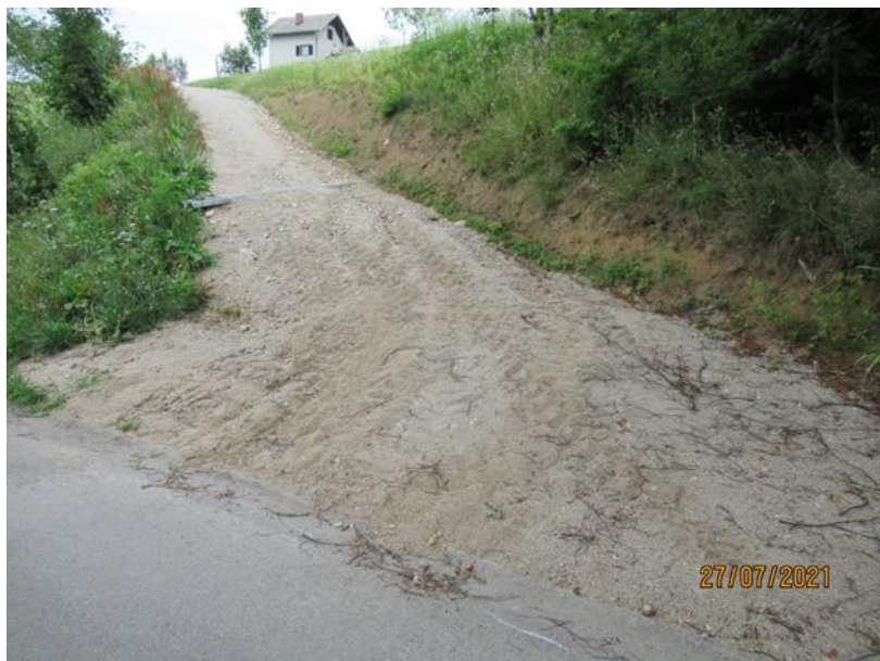
Slika 1: Nepravilno zgrajen cestni priključek

V okviru varstva občinskih cest so posebno pozornost namenili onesnaženju cestišč, ki predstavlja problem predvsem v času opravljanja sezonskih gozdarskih (sečnja in spravilo drevja) in kmetijskih del (oranje spomladi in spravilo poljščin v jeseni). Pojavljajo se tudi posamezni primeri onesnaženja pri opravljanju raznih zemeljskih del in izkopov v začetku gradenj. V okviru izvajanja teh aktivnosti smo nadzirali tudi ustreznost pridobljenih upravnih dovoljenj pri gradnjah in soglasij za izvajanje posegov v varovalnem pasu občinskih cest. Ljudje so vedno bolj osveščeni in si v večini primerov predhodno pridobijo ustrezno soglasje. Težava je še izvedba del v skladu s pogoji iz soglasja.