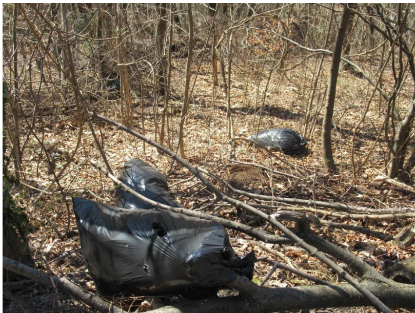
Slika 5: Nepravilno odloženi odpadki v naravnem okolju

Problem neupoštevanja pravil ločenega zbiranja komunalnih odpadkov se pojavlja predvsem pri večstanovanjskih objektih. V letu 2020 je bila izvedena preventivna akcija v Zrečah, ki pa v letu 2021 ni bila izvedena. Ostaja pa v načrtu dela za leto 2022. Nova divja odlagališča v naravnem okolju se skoraj ne pojavljajo več. Odkrita sta bila tudi dva primera nepravilnega odlaganja odpadkov, v obeh primerih je bil uveden prekrškovni postopek.