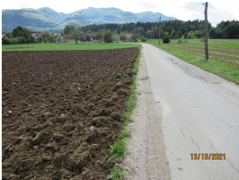
Slika 4: Obdelava zemljišča v cestnem svetu

Še vedno prihaja do obdelave kmetijskih zemljišč (oranje) v cestnem svetu občinskih cest. V letu 2021 je bil postopek z opozorilom po Zakonu o inšpekcijskem nadzoru uveden v štirih primerih. Tudi v prihodnje bodo posebno pozornost pri obdelavi – oranju zemljišč posvetili upoštevanju minimalnega odmika 1 m od cestnega sveta.