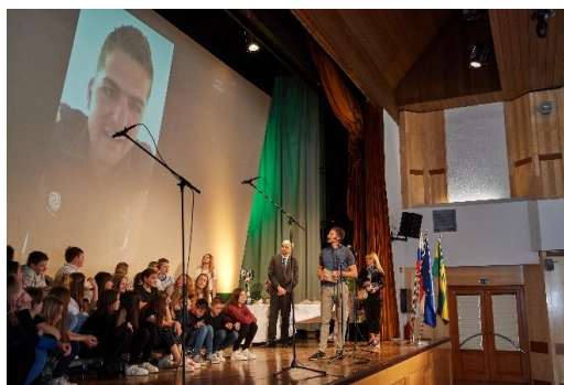
Slike 6, 7 in 8: Utrinki s prireditve Športnik leta 2020/2021

Pripravila: Sandra Vidmar Korošec, višja svetovalka za negospodarske dejavnosti