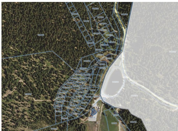
Slika 4: Pripomba pripombodajalcev, za izvzem iz Regijskega parka Pohorje

V času javne razgrnitve osnutka Uredbe o Regijskem parku Pohorje so na Ministrstvu za okolje in prostor prejeli pripombe 21. pripombodajalcev. Med njimi je bila prejeta tudi pripomba 22 sopodpisnikov, ki predlagajo izločitev dela območja iz Regijskega parka. Gre za območje v gozdnem zemljišču v neposredni bližini Mašin žage na Rogli - slika spodaj.