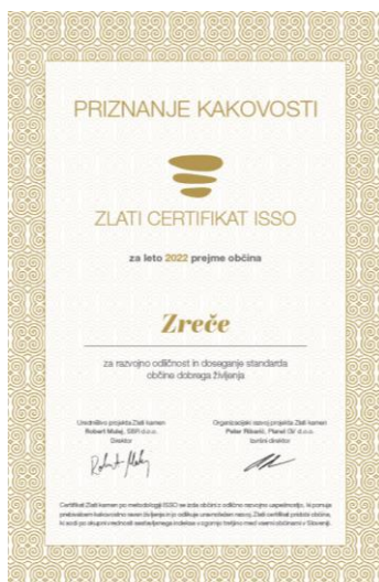
Slika 3: Zlati certifikat ISSO 2022 Občine Zreče

Pripravila: Milena Slatinek, višja svetovalka za gospodarske dejavnosti