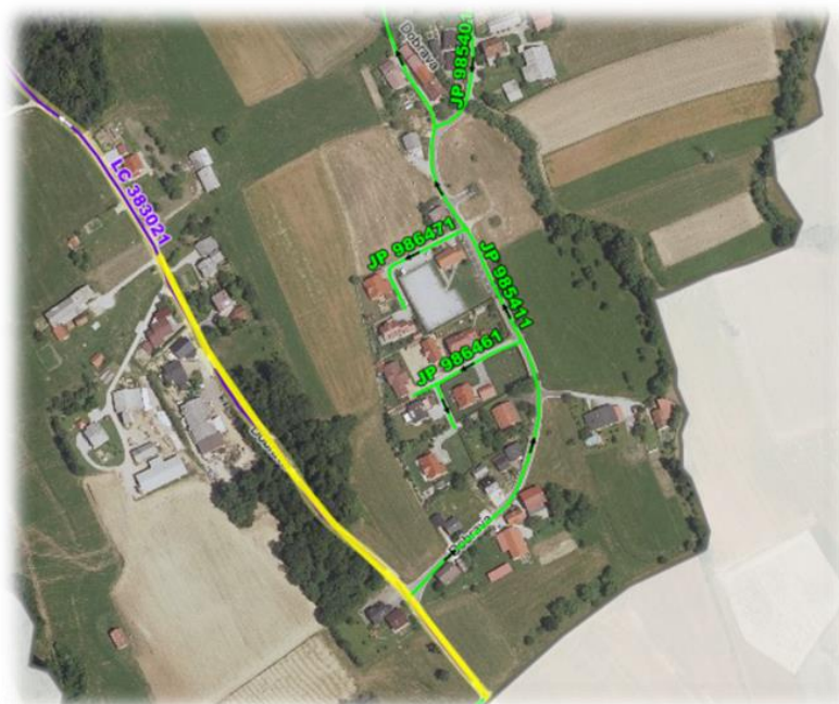
Slika 5: Lokacija obnove dela lokalne ceste (označeno rumeno)

V letošnjem letu bomo izvedli sanacijo dela LC 383021 Dobrava-SI. Konjice od meje z Občino Slovenske Konjice v dolžini cca 400 m. Za predvideno sanacijo smo pridobili projektno dokumentacijo IPZ 25/2021/2, Modernizacija LC 383021 Dobrava, marec 2022, ki jo je izdelal Procening, Boštjan Gabrijan s.p., Gorkega ulica 51, 2000 Maribor. Dela bo izvajal najugodnejši ponudnik t. j. VOC d.o.o. iz Celja. Trenutno smo v fazi podpisa pogodbe. Vrednost pogodbenih del znaša 95.680,20 €. Dela bomo izvajali v mesecu maju in juniju.