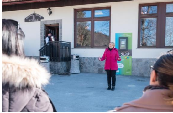
Sliki 1 in 2: Utrinka z otvoritve

Pripravila: Milena Slatinek, višja svetovalka za gospodarske dejavnosti