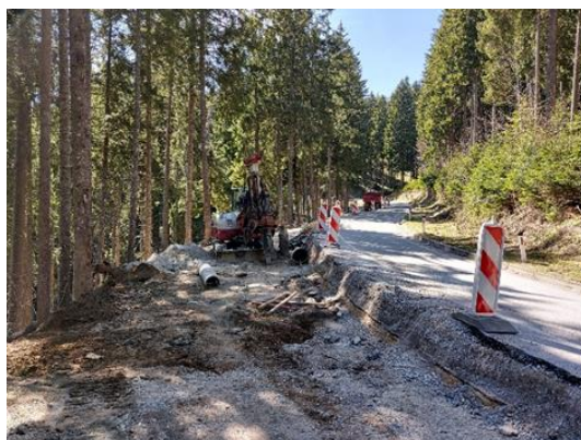
Slika 15: Dela na usadu pod Roglo