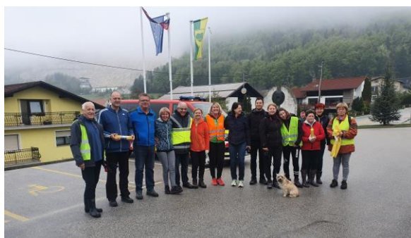
Slike 11, 12 in 13: Nekaj utrinkov s spomladanske čistilne akcije 2022