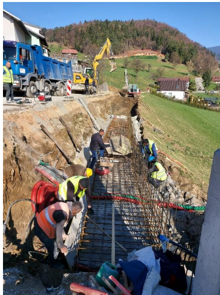
Slika 14: Dela na odseku Mladinska ulica-krožišče Padežnik

Pogodba z izbranim izvajalcem del VOC d.o.o., Celje je bila podpisana 30. 7. 2021 v vrednosti 725.624,98 € z DDV. Sofinancerski delež Občine Zreče znaša 161.914,04 € z DDV. Uvedba v delo je bila izvedena v mesecu avgustu 2021. Izvajalec del VOC d.o.o. je z deli pričel 7. 3. 2022. Rok za dokončanja del je 300 dni od uvedbe v delo oz. do 4. 6. 2022. Izvedena je komunalna infrastruktura za 1. fazo (vodovod, odvodnjavanje ceste, JR in IKT) in podporni zid, odsek od Mladinske ulice do križišča za Vodovodno in Obvozno cesto. Trenutno se nadaljuje izgradnja komunalne infrastrukture za 2. fazo (vodovod, odvodnjavanje ceste, fekalna kanalizacija, JR in IKT) ter podporni zid in odsek od križišča za Vodovodno in Obvozno cesto do krožišča Padežnik. Po informacijah izvajalca del naj bi se reciklaža začela izvajati v drugi polovici meseca maja 2022 in zaključila z asfalterskimi deli v začetku junija 2022.