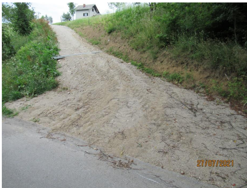
Slika 1: Nepravilno zgrajen cestni priključek

Pogosto se srečujemo s primeri visoke vegetacije v križiščih občinskih cest oz. na individualnih priključkih na občinsko cesto. Pri tem skušamo uveljaviti pravilo, ki velja na državnih cestah, da visoka vegetacija ne sme biti vzrok za postavitve ogledal, temveč je potrebno vegetacijo oblikovati tako, da je zagotovljena ustrezna preglednost.