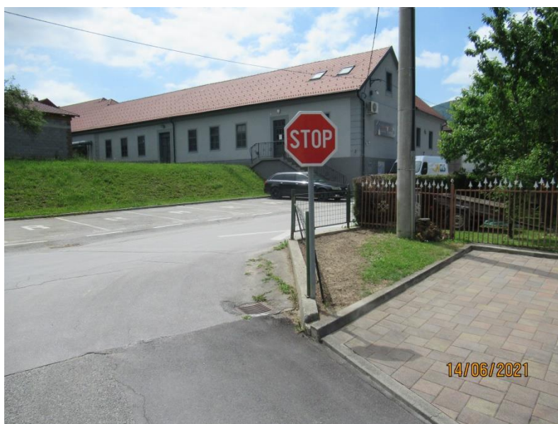
Slika 3: Stanje po ureditvi

Opažamo tudi, da še vedno in pogosto prihaja do obdelave kmetijskih zemljišč (oranje) v cestnem svetu občinskih cest. V letu 2021 je bil postopek z opozorilom po Zakonu o inšpekcijskem nadzoru uveden v štirih primerih. Tudi v prihodnje bomo posebno pozornost pri obdelavi – oranju zemljišč posvetili upoštevanju minimalnega odmika 1 m od cestnega sveta. Ugotavljamo, da občani ne poznajo pojma 'cestni svet', ki poleg samega vozišča zajema še bankine in obcestne jarke oz. brežine vkopov.