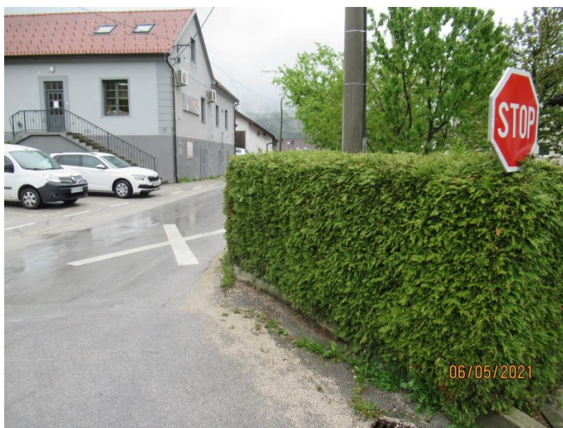
Slika 2: Vegetacija v križišču občinskih cest onemogoča preglednost

Pogosto se srečujemo s primeri visoke vegetacije v križiščih občinskih cest oz. na individualnih priključkih na občinsko cesto. Pri tem skušamo uveljaviti pravilo, ki velja na državnih cestah, da visoka vegetacija ne sme biti vzrok za postavitve ogledal, temveč je potrebno vegetacijo oblikovati tako, da je zagotovljena ustrezna preglednost.