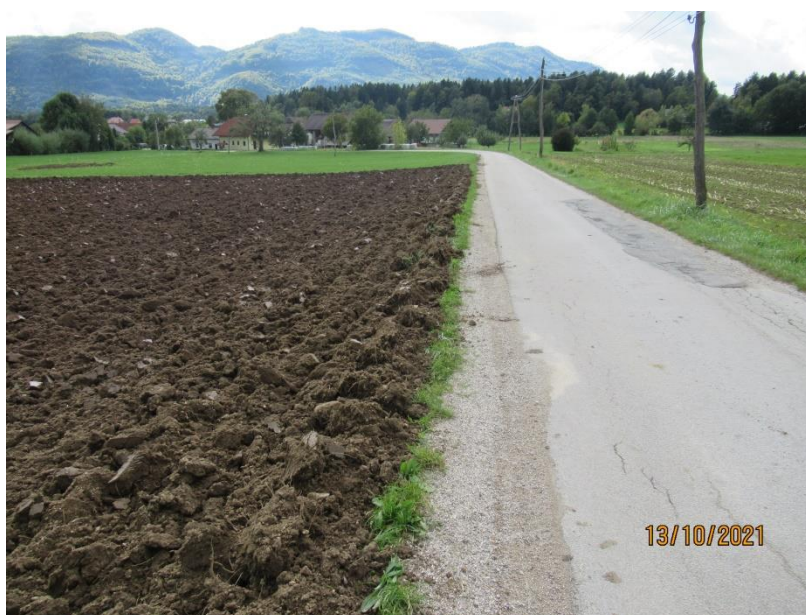
Slika 4: Obdelava zemljišča v cestnem svetu

Opažamo tudi, da še vedno in pogosto prihaja do obdelave kmetijskih zemljišč (oranje) v cestnem svetu občinskih cest. V letu 2021 je bil postopek z opozorilom po Zakonu o inšpekcijskem nadzoru uveden v štirih primerih. Tudi v prihodnje bomo posebno pozornost pri obdelavi – oranju zemljišč posvetili upoštevanju minimalnega odmika 1 m od cestnega sveta. Ugotavljamo, da občani ne poznajo pojma 'cestni svet', ki poleg samega vozišča zajema še bankine in obcestne jarke oz. brežine vkopov.