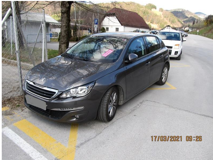
Slika 5: Nepravilno parkirano vozilo

Na področju zapuščenih in izrabljenih vozil smo v letu 2021 obravnavali 2 primera, v obeh primerih sta lastnika po izdani odredbi vozili sama odstranila.