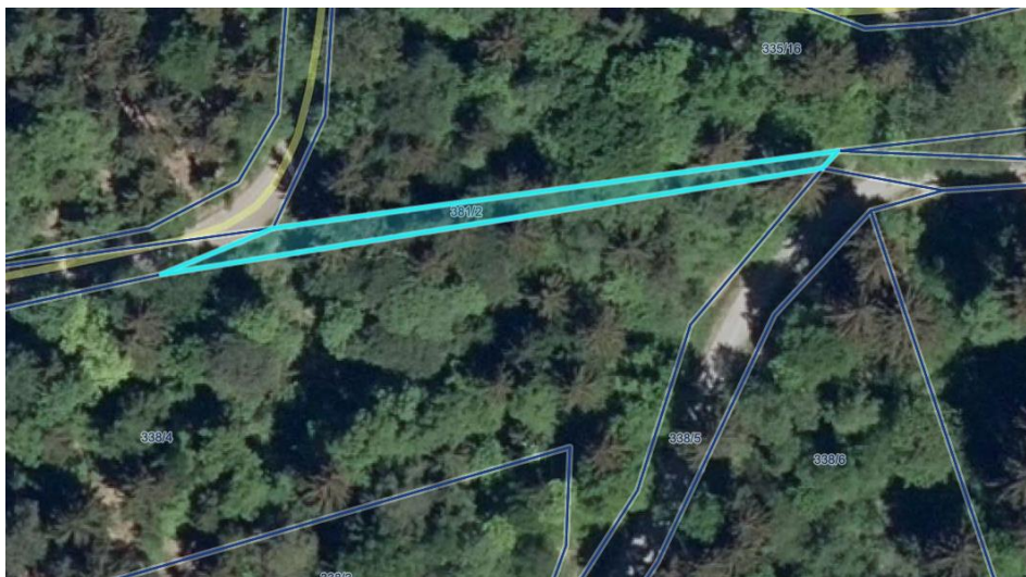
Parc. št. 381/2, k.o. 699 – Hočko Pohorje (javno dobro)