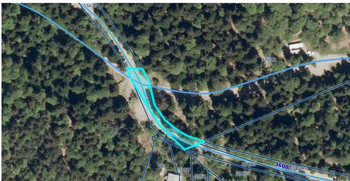
Parc. št. 334/31, k.o. 699 – Hočko Pohorje