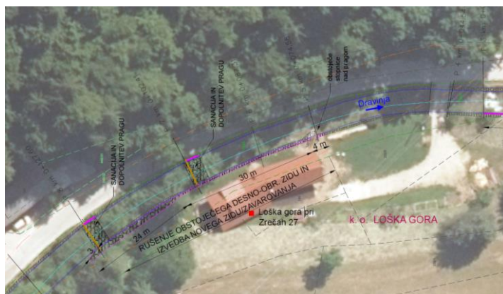
Slika 11: Načrt sanacijskih del

Pripravil: Andrej Furman, delovodja za komunalno infrastrukturo