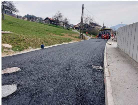
Sliki 5 in 6: Izgradnja kanalu S14 in zaključek del na kanala S13

V 2. fazi pa smo izvedli ostalo komunalno infrastrukturo (elektro vod, vodovod, optika Xenex in RUNE). Izvajalec del AGM Nemeč je izvedel izkop in polaganje optike in elektro kabla ter zasip. Elektro MB je dobavil elektro kabel, občina je dobavila in položila vodovodno cev. Vse navedeno vključno s sanacijo Tovarniške ceste smo končali sredi decembra 2022. Zaradi vremenskih razmer pa ni bilo mogoče položiti vsaj grobe asfaltne prevleke, kar se planira takoj po odprtju asfaltnih baz. Po informacijah izvajalca smo takoj v začetku marca pričeli s pripravo Tovarniške ceste, in sicer smo z asfaltiranjem pričeli 20. 3. 2023 in zaključili naslednji dan 21. 3. 2023 s fino asfaltno prevleko. Po novem letu pa smo nadaljevali dela tudi na kanalu S14, ki pa smo jih zaključili v začetku marca 2023. Po 23. 3. 2023 pa se nadaljujejo dela na kanalu S13 območje Brega in na kanalu S13.1 Vinogradniška ulica.