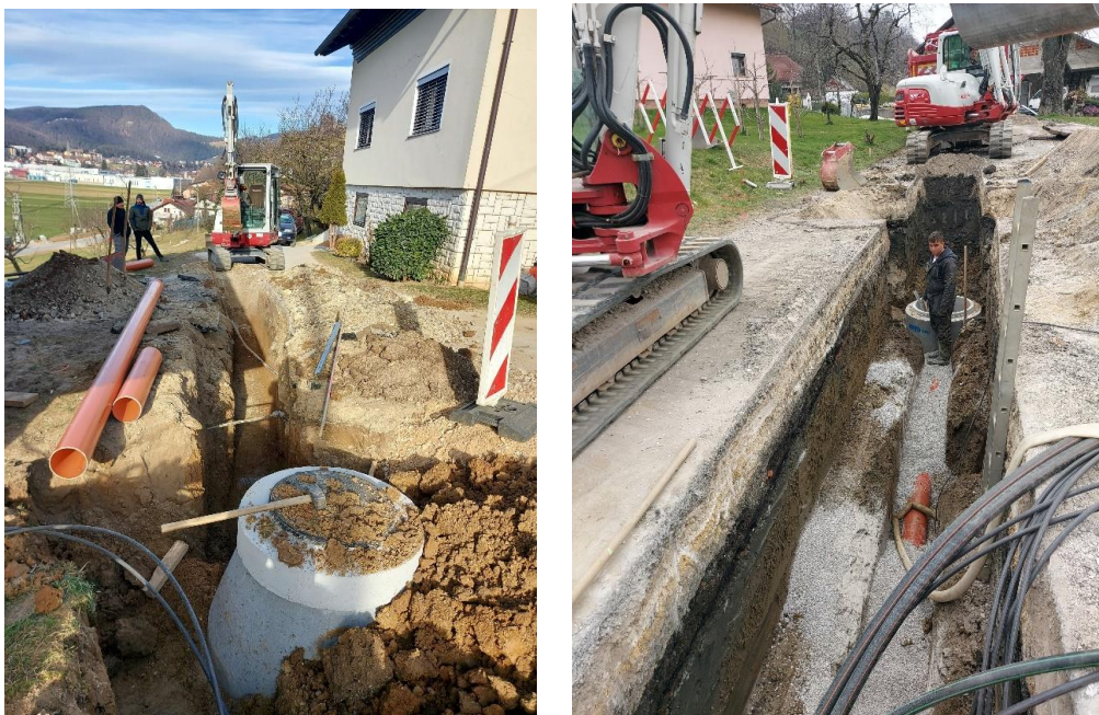
Sliki 9 in 10: Izgradnja kanala S9.4 in kanala S12.3

Pripravil: Štefan Posilovič, vodja NOE GJS in prostor