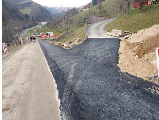
Sliki 7 in 8: Izgradnja kanala S4

Spomladi, predvidoma v začetku marca 2023, se nadaljujejo dela na odseku proti LD Zreče ter nadaljujejo dela na Ulici Borisa Vinterja in Strmi cesti, kar pa bi zaključili poleti 2023.