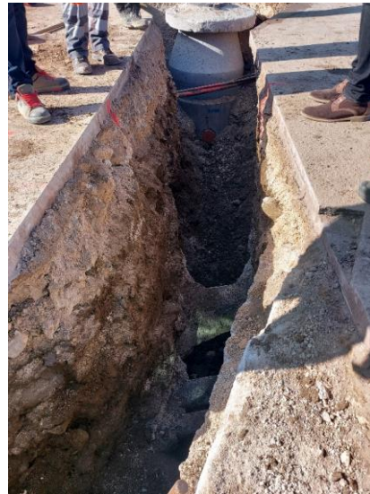
Sliki 1 in 2: Izgradnja kanala S1.1