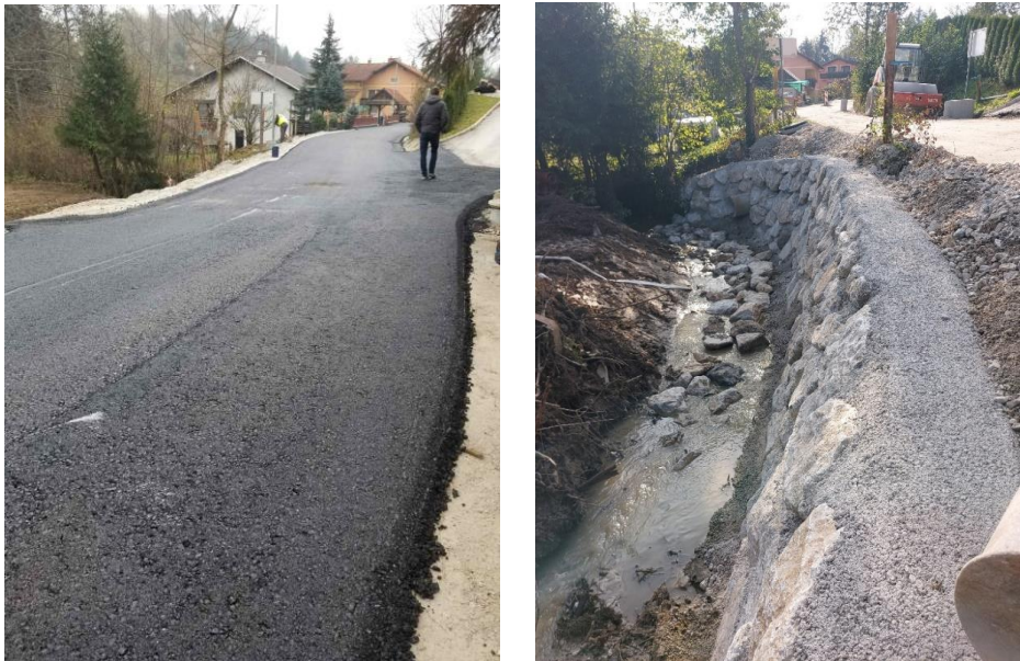
Sliki 3 in 4: Izgradnja kanala Osredek

Izgradnjo sekundarnega fekalnega kanalizacijskega omrežja smo začeli izvajati v začetku meseca oktobra 2021. Pogodbena vrednost na sklopu 3 Izgradnja kanala Vidner – Osredek in kanala Osredek je v vrednosti 250.689,80 € brez DDV. Izvajalec AGM NEMEC bo zgradil 1,06 km sekundarne kanalizacije na tem območju. S tem bomo omogočili priključitev na ČN Zreče 51 prebivalcem omenjenega območja. Do danes je zgrajeno kanalizacijsko omrežje s hišnimi priključki in izvedeno črpališče z vsemi povezavami. 26. 4. 2022 smo pričeli s sanacijo vozišča oz. ceste in ureditev pločnika ter JR na odseku Vidner do Koprivnice, kar je bilo zaključeno 12. 8. 2022. Do konca leta smo nato zaključili dela na sanaciji ceste v Osredku, kjer se je izvedel še nov vodovod, optična kanalizacija 2x in javna razsvetljava in gobo asfaltiranje. Do konca meseca aprila 2023 se bodo dela zaključila s finim asfaltom in končno ureditvijo okolice.