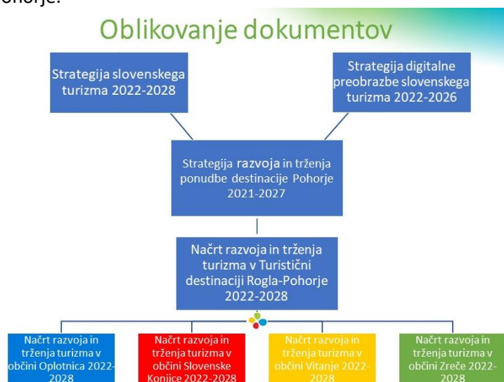
Slika 1: Konceptualni okvir izdelave strateških dokumentov.

Ekipa TDRP se je priprave strateških dokumentov lotila metodično z uporabo vseh razpoložljivih virov, ki so bili osnova in podlaga za osnutke dokumentov. Osnova za pripravo in oblikovanje dokumentov je bila Strategija slovenskega turizma 2022-2028 , Strategija digitalne preobrazbe slovenskega turizma 2022-2026 ter Strategija razvoja in trženja ponudbe destinacije Pohorje 2021-2027 , ki je bila pripravljena za občine v sklopu Partnerstva za Pohorje.