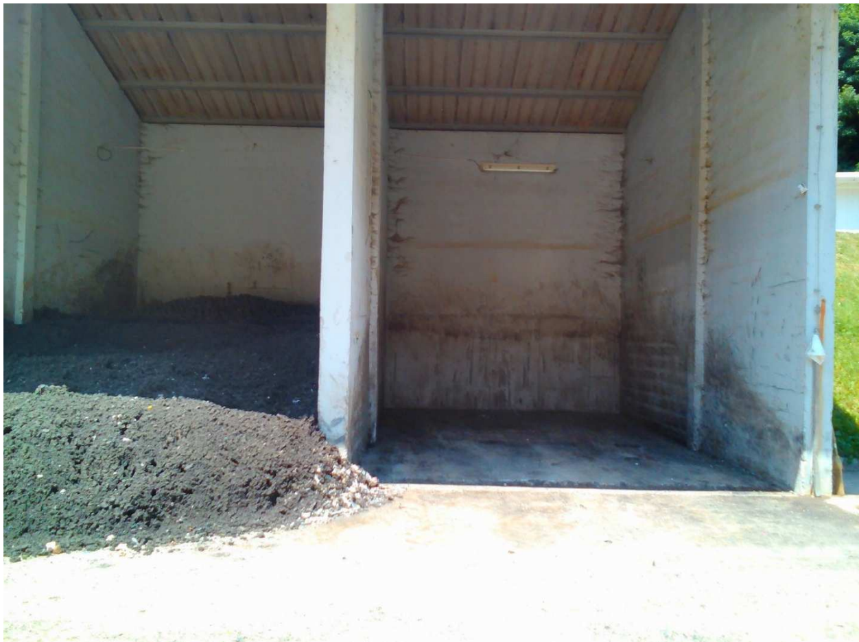
Slika 3: začasno skladiščenje blata v Globokem

Dehidrirano blato se bo s samonakladalnim vozilom odpeljalo na začasno skladiščenje v Globoko. Dehidrirano blato bomo proti plačilu oddajali pooblaščenemu zbiralcu, ki bo ponudil najnižjo ceno.