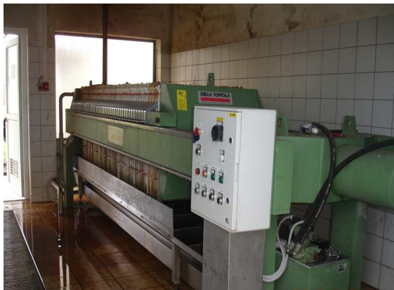
Slika 1: stiskalnica za blato na KCN Trebnje

V primeru izgradnje kakšne čistilne naprave na območju občine Mirna v velikosti med 50 in 2000 PE, pa se bo obdelava blata najverjetneje zagotavljala na čistilni napravi Trebnje, ki je sposobna sprejemati blato iz malih komunalnih čistilnih naprav, ki so enake ali večje od 50 PE in je v upravljanju Komunale Trebnje d.o.o..