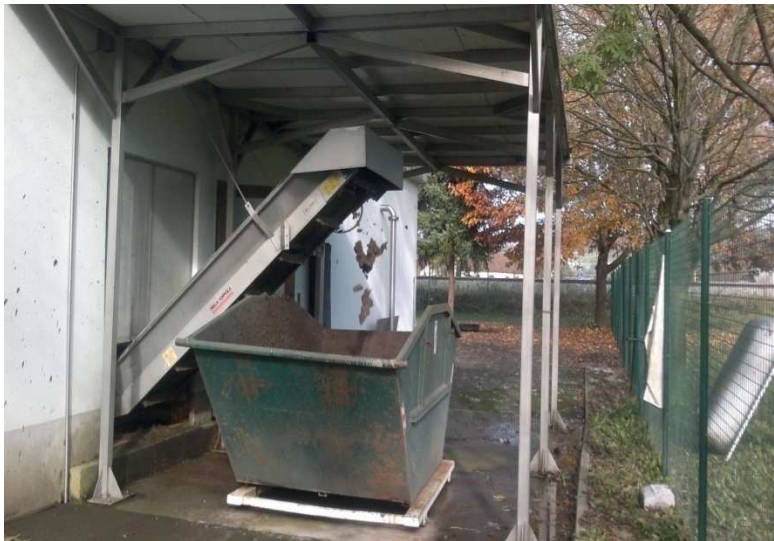
Slika 2: dehidrirano blato v Trebnjem

Dehidrirano blato se bo s samonakladalnim vozilom odpeljalo na začasno skladiščenje v Globoko. Dehidrirano blato bomo proti plačilu oddajali pooblaščenemu zbiralcu, ki bo ponudil najnižjo ceno.