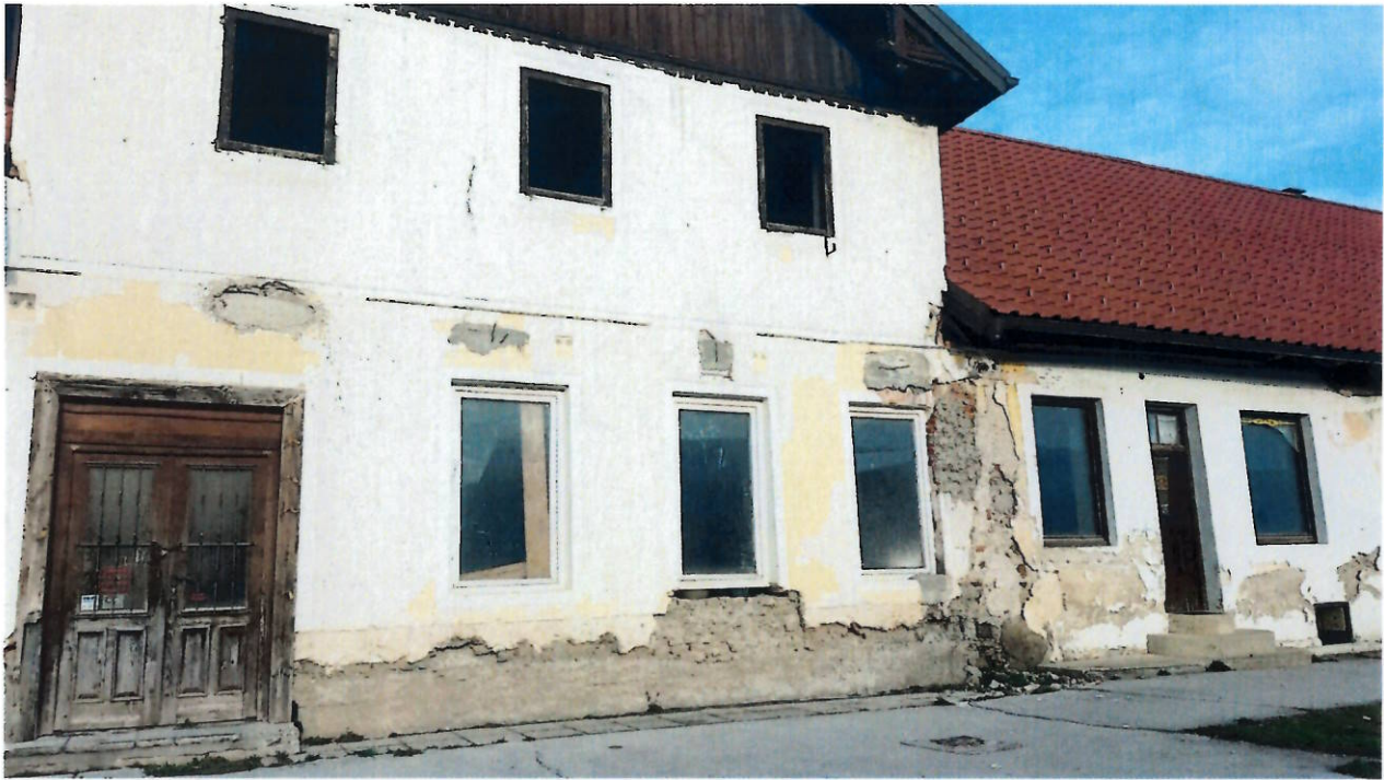
Močno odpadanje zaključnih plasti fasade, njena močna onesnaženost in spremembe njene barve ter teksture, zamakanje fasade ter poškodbe stavbnega pohištva