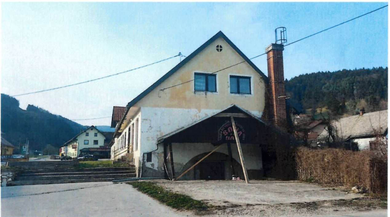
Statično nezanesljivi leseni nadstrešek ob objektu