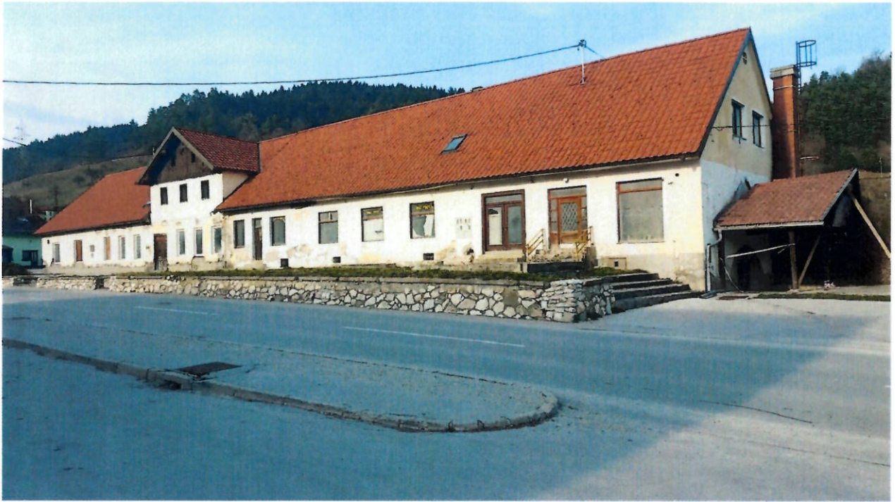
Pogled na objekt z Kovaške ceste