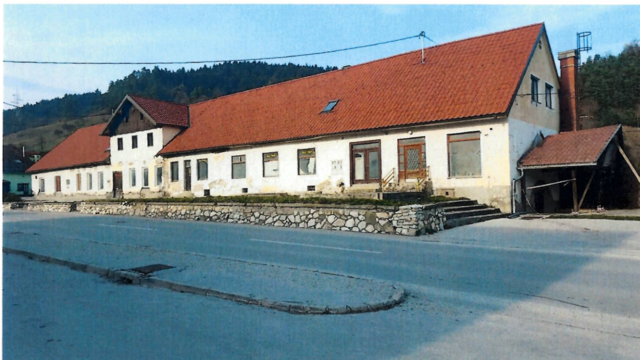
Lega ob prometni vpadnici Zreče – Rogla, lega ob zdravstvenem domu