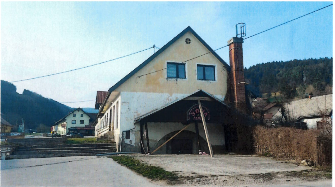
Pogled na objekt z zdravstvenega doma