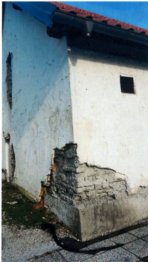
Poškodovani omet in zidovje