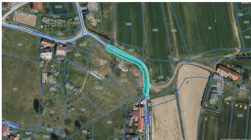
Slika 1: Nepremičnina s parc. št. 42/4, k.o. Dolič – v izmeri 528 m 2

Pridobijo se nepremičnina s parc. št. 42/4, k.o. Dolič (362) – v izmeri 528 m 2 in nepremičnine s parc. št. 198/4, 195/1, 43/2, 80/2, vse k.o. Destrnik (363), v skupni 638 m 2 . Nepremičnine v naravi predstavljajo kategorizirano javno pot JP 560612 (RAJŠP-JAKOB). Parcele so bile pred leti s tem namenom že odmerjene vendar prenos še ni bil izvršen zato so se lastniki s pobudo za prenos obrnili na občinsko upravo.