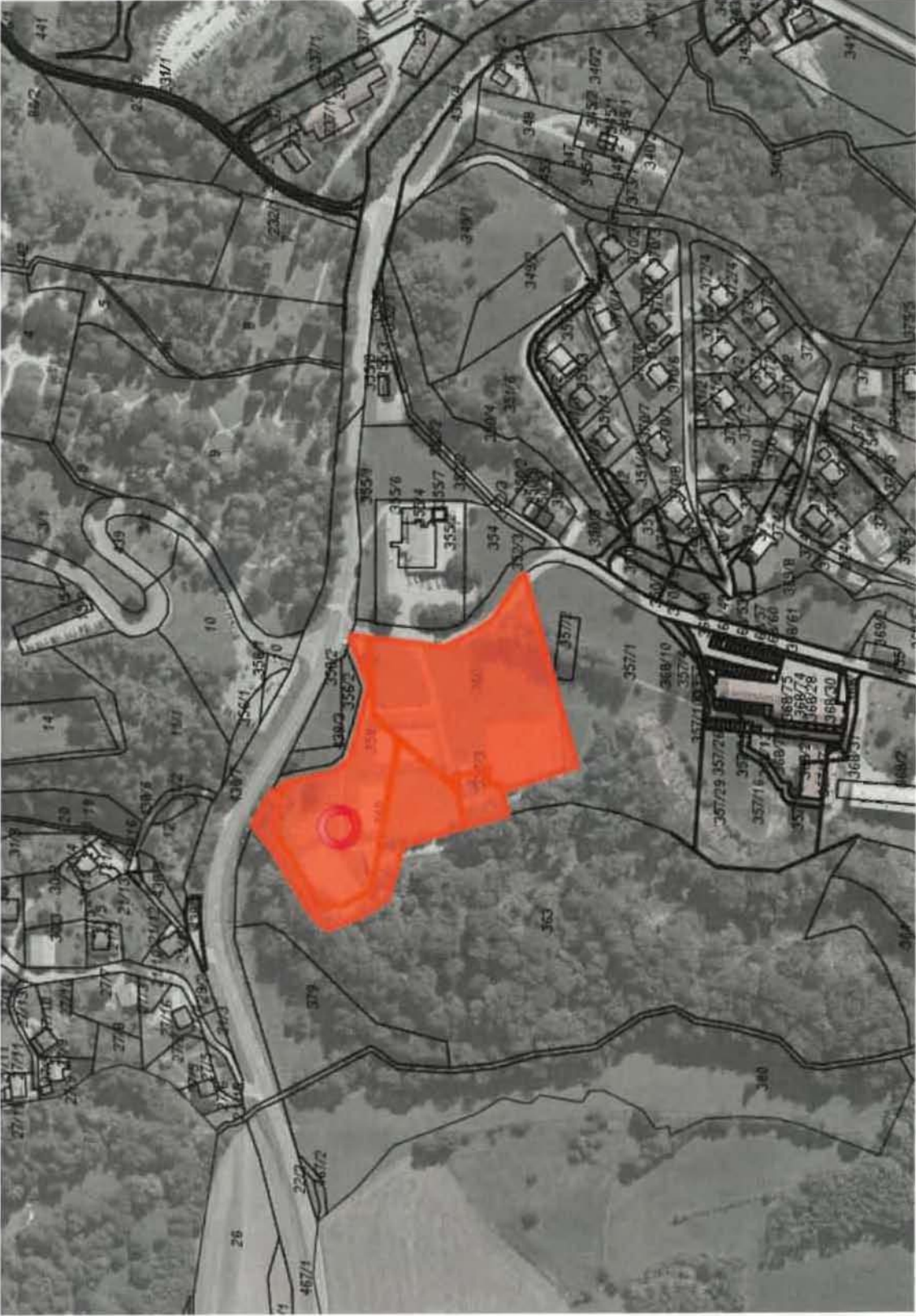
Parc. št. 357/3, 359 in 360, vse k.o. Golnik