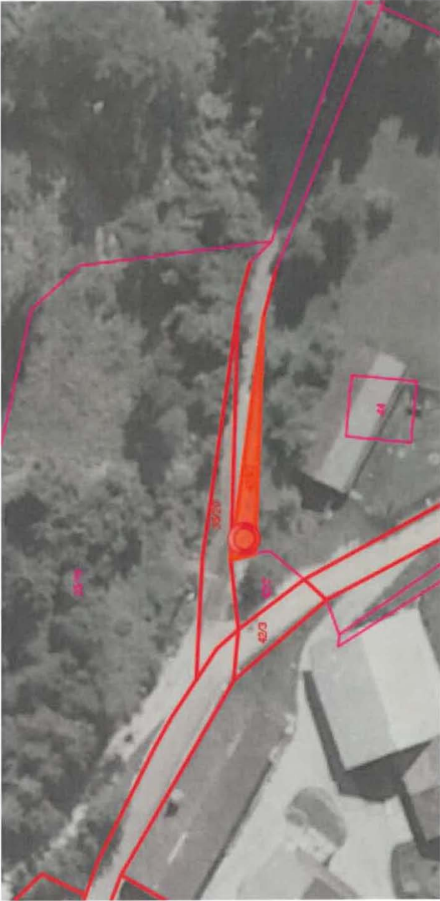
Parc. št. 435/2 k.o. Golnik