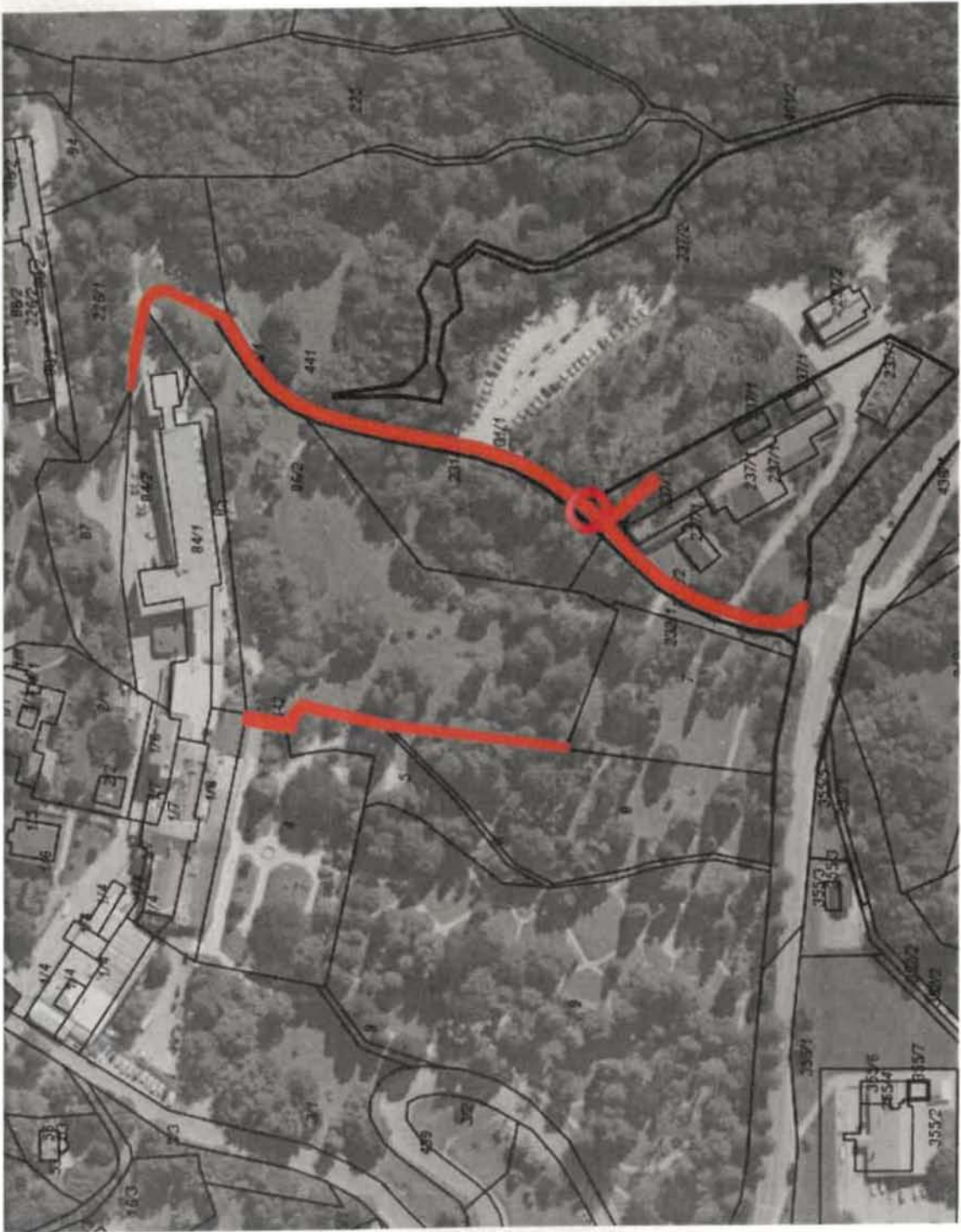
Parc. št. 441, 442 in 443, vse k.o. Golnik