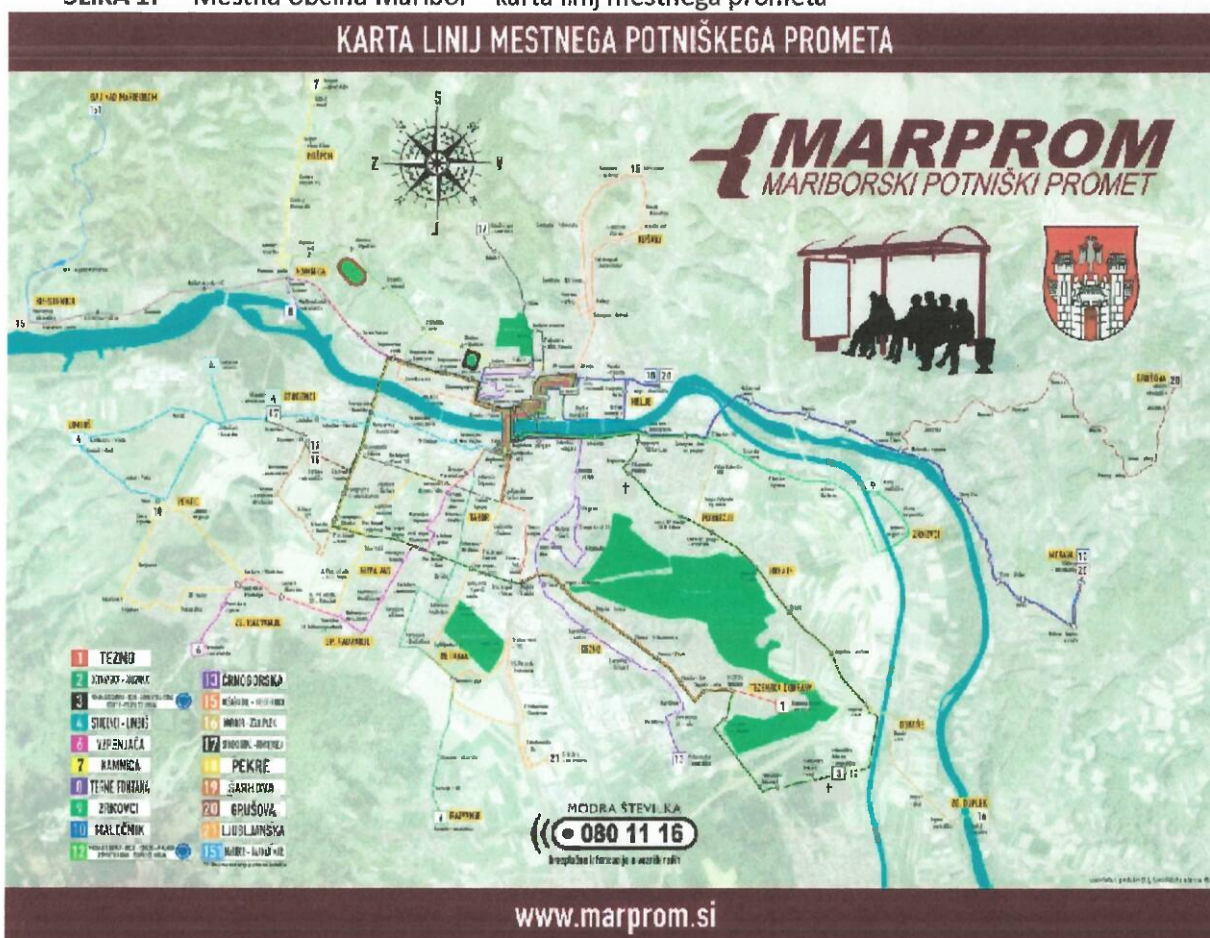
SLIKA 1: Mestna občina Maribor – karta linij mestnega prometa